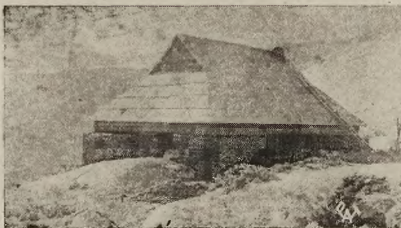
Schronisko sekcji żeglarskiej warszawskiego A. Z. S. w Czarnohorze.