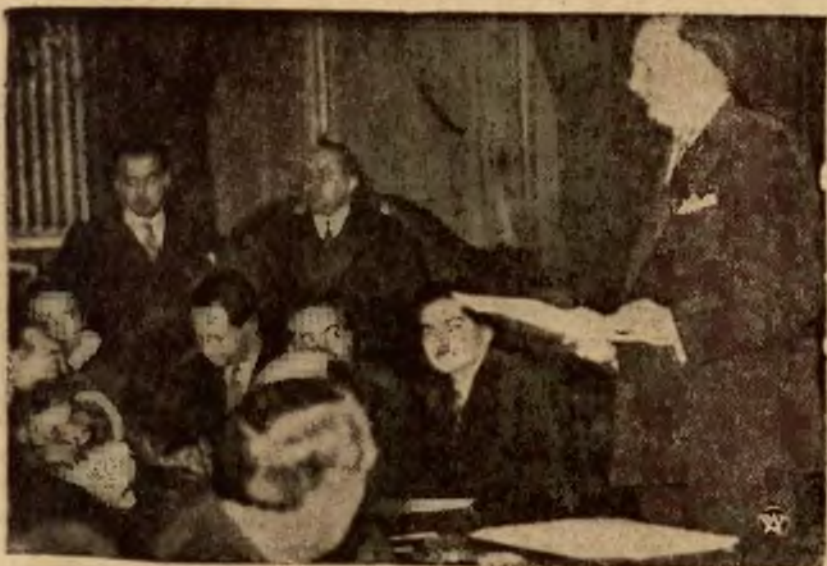
Po wypowiedzeniu przez rząd Rzeszy Niemieckiej traktatu lokarneńskiego i okupacji przez wojska niemieckie zdemilitaryzowanej strefy nadreńskiej, rozpoczęła się w Paryżu gorączkowa akcja dyplomatyczna dla zajęcia stanowiska wobec kroku rządu Rzeszy, skierowanego według opinii politycznych kół paryskich bezpośrednio przeciwko Francji. W związku z tem odbyła się w Paryżu konferencja przedstawicieli mocarstw — sygnatariuszy traktatu lokarneńskiego. Zdjęcie nasze przedstawia ministra Spraw Zagranicznych Francji Flandina, w momencie odczytywania memorandum rządu Rzeszy Niemieckiej w czasie wymienionej konferencji. Narady te, jak wiadomo, będą kontynuowane w Londynie, gdzie również została zwołana na dzień 14-go b. m. nadzwyczajna sesja Rady Ligi Narodów.