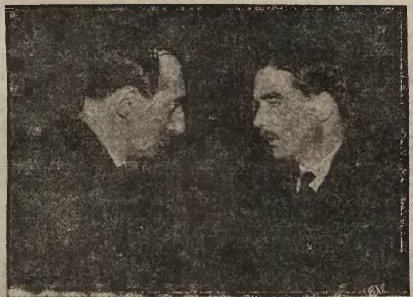
Min. Eden w rozmowie z min. Beckiem.

Obaj ministrowie uznali zgodnie, że ich wymiana myśli o charakterze informacyjnym odpowiedziała swemu zadaniu. Podkreśliła ona celowość utrzymania ścisłego kontaktu w związku z dalszym rozwojem sytuacji politycznej w Europie.