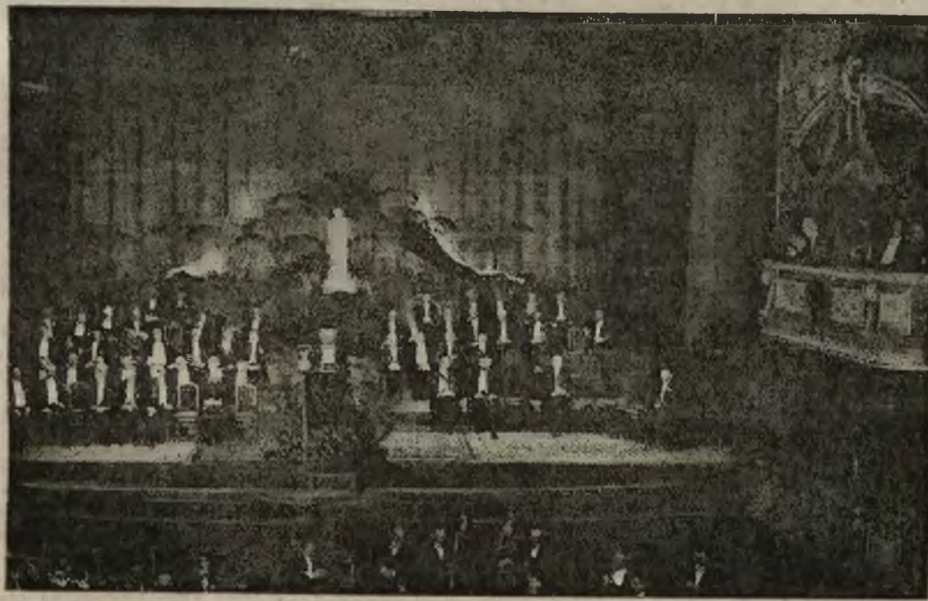
W ub. poniedziałek odbyła się w Teatrze Wielkim w obecności P. Prezydenta Rzpietey i członków rządu uroczysta akademja ku czci s. p. Marji Skłodowskiej-Curie. Na zdjęciu — moment uroczystości.