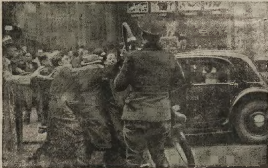
Francuscy studenci gwałtownie zaprotestowali przeciw dopuszczaniu cudzoziemców na uniwersytety francuskie. Szczególnie ostre protesty doszło do rozruchów, które policja zmuszona była tłumić przy użyciu siły.