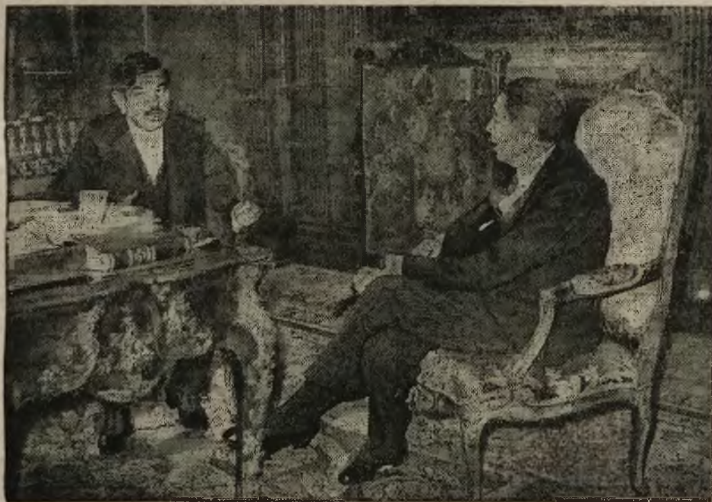
Minister Spraw Zagranicznych Francji Piotr Laval ostatnio urządził na Quai d'Orsay na cześć rumuńskiego ministra Spraw Zagranicznych Titulescu przyjęcie, któremu powszechnie przypisuje się wielkie znaczenie. Na zdjęciu — Laval (na lewo) podczas przyjęcia w ministerstwie Spraw Zagranicznych.