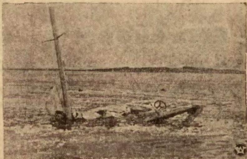
W Węgoborku (Angerburg) w Prusach Wschodnich odbyły się międzynarodowe zawody ślizgowców o mistrzostwo Europy z udziałem reprezentacji Polski. — Na zdjęciu I — reprodujemy ślizgowce w czasie startu, zaś na zdjęciu II — moment załamania się ślizgowca wskutek kruchości powłoki lodowej.