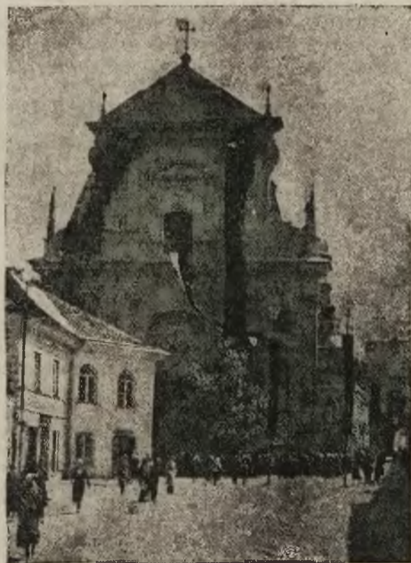
Na zdjęciu pierwszym kościół św. Teresy w Ostrej Bramie, w którym złożono chwilowo serce Marszałka Piłsudskiego i prochy Jego Matki. Na drugim patkownicy przenoszą z dworca lektykę, kryjącą urnę z sercem.

ATENY. (Pat.) Plebiscyt w sprawie ustroju w Grecji, mający dać odpowiedź na pytanie, czy będzie przywrócona monarchja odbędzie się w drugiej połowie lipca.