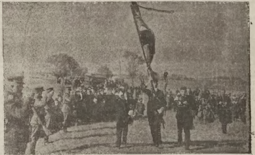
Poczet szlendarowy „Laudy” na czele konduktu żałobnego zbliża się do granicy polskiej.