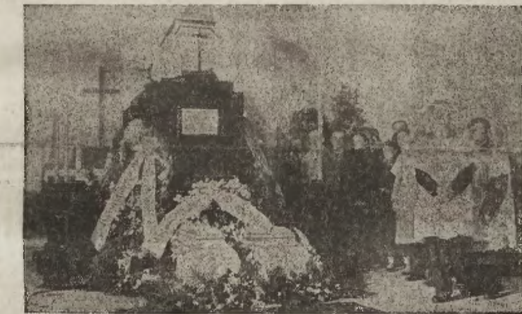
Trumny Matki i rodzeństwa Marszałka w podziemiach kościoła św. Teresy.