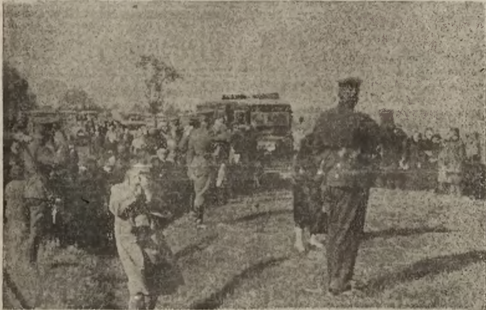
Po stronie litewskiej na chwilę przed przekroczeniem granicy. Orkiestra już gra hymn narodowy, policja i wojskowi Litwcy salutują.

W dolnym kościele trumnę ustawiono na katafalku. U nóg na podjum małym złożono dwie trumienki. Rozpoczęło się nabożeństwo.