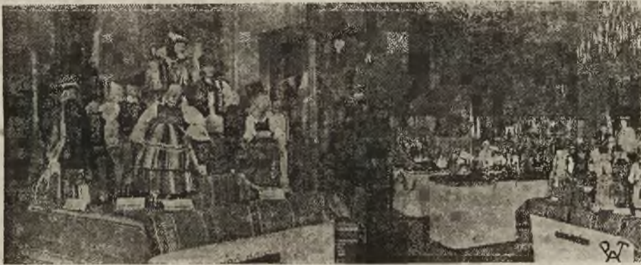
Fragment głównej Międzynarodowej sali w Strasburgu. Na lewo — stoisko polskie.