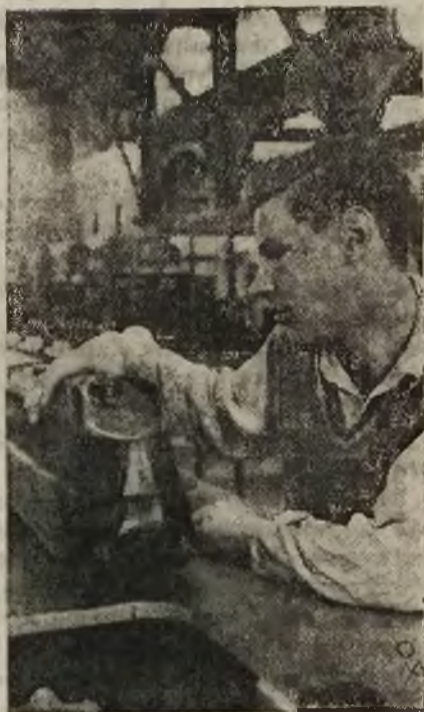
Nowy model lokomotywy o kształtach aerodynamicznych, wystawiony ostatnio w jednym z muzeów berlińskich.