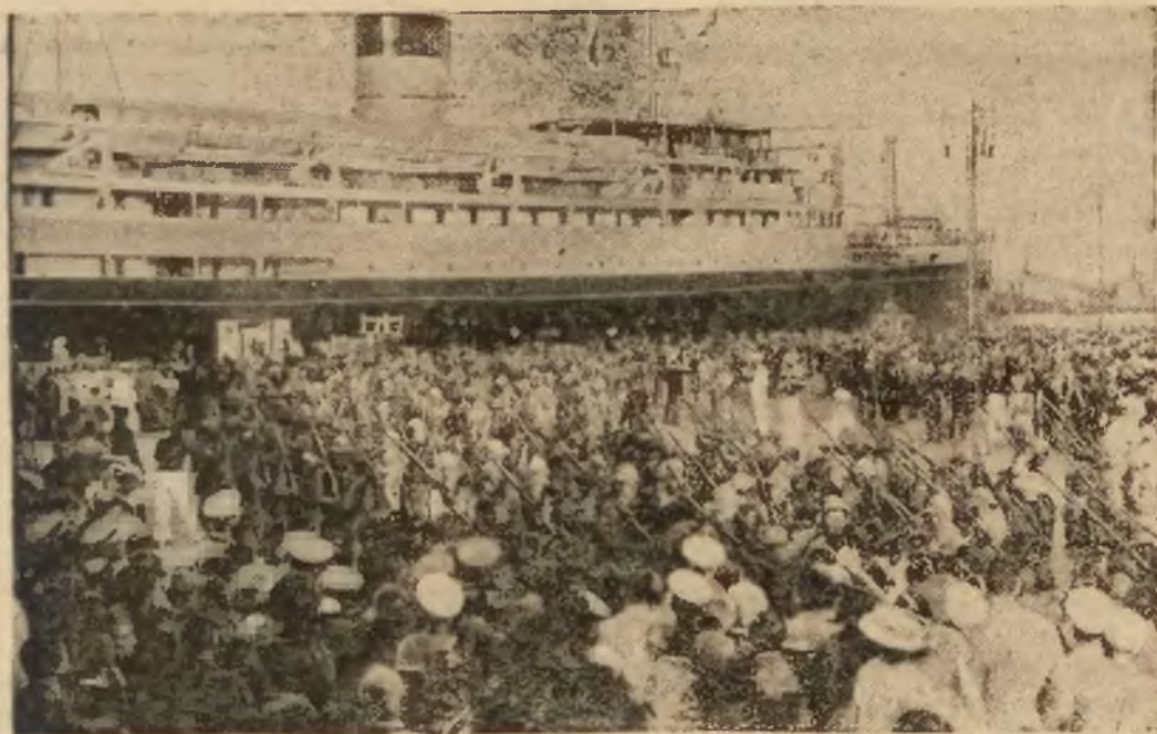
Studencki batalion czarnych koszul „Quartano de Montanara” witany po powrocie z Afryki przez ks. Umberto w Neapolu.