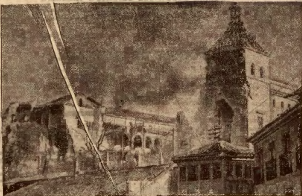
Alcazar w Toledo, jeden z najpiękniejszych za bytków w Hiszpanji z XIII w., od wielu już tygodni jest oblegany przez wojska czerwone i mimo to nie został jeszcze zdobyty. Na ilustracji — spustoszenie, jakie poczyniły w Alcazarze pożary i bombardowanie.