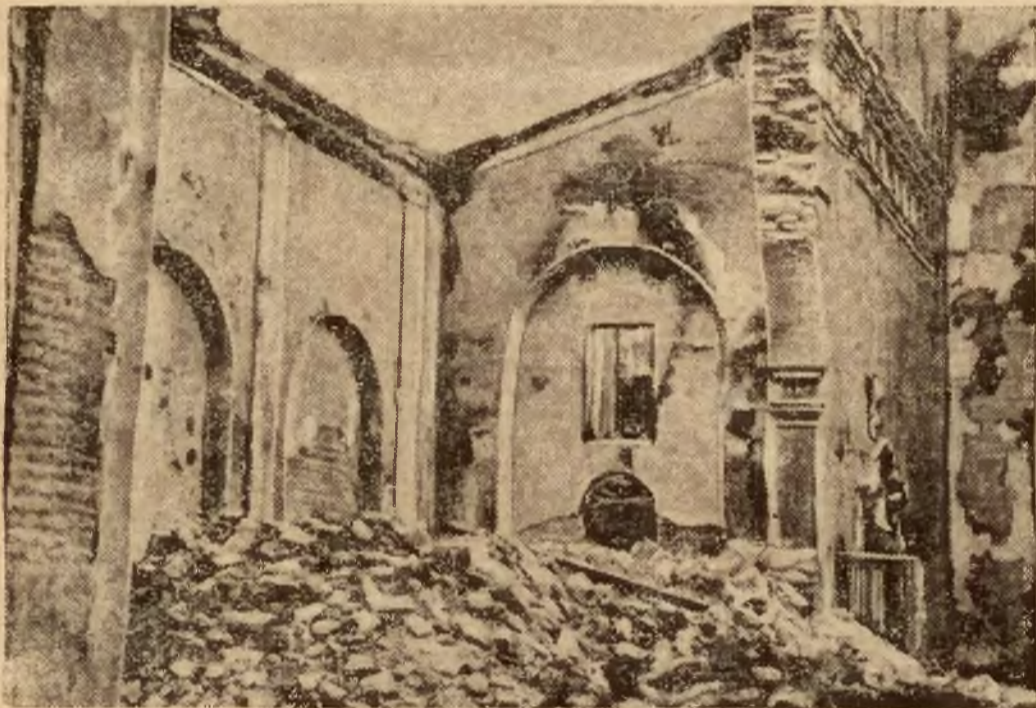
Wnętrze kościoła w San Roque (połud. Hiszpanja) zburzonego przez oddział milicji rządowej.