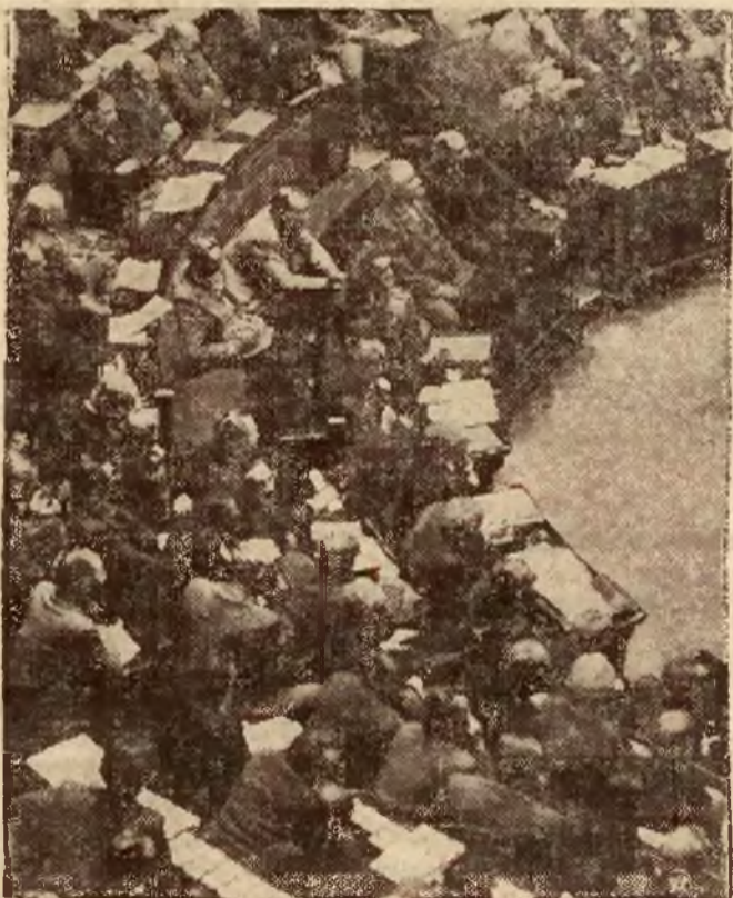
Zdjęcie nasze przedstawia ławy rządowe we francuskiej Izbie Deputowanych, w czasie ostatniej girającej debaty nad ustawą o dewaluacji franka. Premier Blum prowadzi ożywioną rozmowę z ministrem Skarbu Vincent Auriol'em.