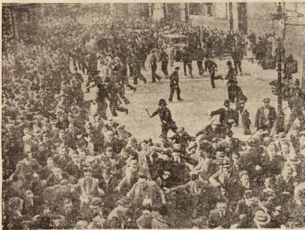
faszystami i antyfaszystami. Zdjęcie przedstawia w Londynie doszło do starć ulicznych między momentem kiedy pociąga rozpędza manifestujących antyfaszystów.