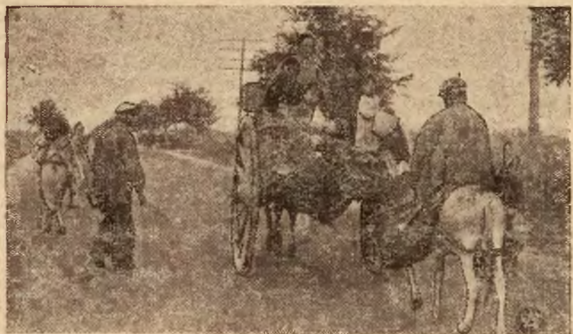
Nieszczęśliwa ludność hiszpańska, uciekająca z terenów bezpośrednich walk.

W walkach w Oviedo odgrywają decydującą rolę auta pancernie obsadzone przez górników. Za samochodami najężonymi karabinami maszynowymi posuwają się górnicy, uzbrojeni w bomby i naboje dynamitowe, wypierając granatami ręcznymi i rzucanymi ładunkami dynamitowymi powstańców ukrytych w poszczególnych domach.