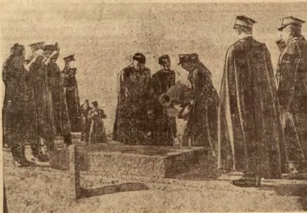
Uroczysty hołd przedstawicieli armii włoskiej na Sowińcu.