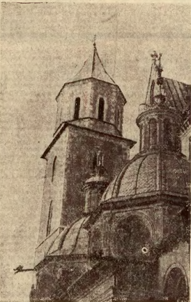
Reprodukcujemy fragment t. zw. Wieży Srebrnych Dzwonów w Katedrze Wawelskiej, pod którą w specjalnej krypcie ma spocząć na zawsze sarkofag z doczesnymi prochami Pierwszego Marszałka Polski Józefa Piłsudskiego.