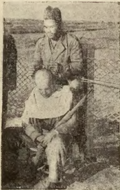
1 na froncie madryckim dbają żołnierze o swój wygląd zewnętrzny. Nawet podczas zabiegów fryzjerskich nie odłącza się milicjant od swego karabinu.

Najbardziej ożywiona arteria Madrytu — ulica Toledo — była zupełnie pusta. Tramwaje kursowały regularnie. O godz. 11 ulice powróciły do normalnego stanu.