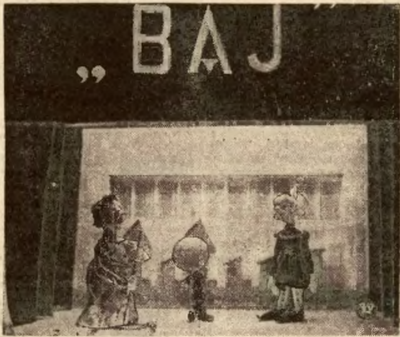
Wielką popularnością cieszą się przedstawienia dla dzieci teatryku młodzieżowego „Baj”, urządzane na scenie Teatru Wielkiego w Warszawie. Zdjęcie nasze przedstawia jeden z efektownych „żywych obrazów” tego teatryku, serdecznie oklaskiwanego przez liczną zgromadzoną na widowni publiczność.

Artysta-malarz teatrów miejskich W. MAKOJNIK PROJEKTY WNĘTRZ (mieszkania, biura, sklepy i t. d.) Wiwulskiego 6 m. 15, tel. 23-77