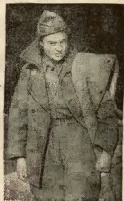
Na froncie hiszpańskim walczy wielka ilość kobiet, szczególnie po stronie wojsk rządowych. Na ilustracji widzimy Angielkę, która z pełnym rynsztunkiem zgłosiła się dobrowolnie i walczy po stronie rządu madryckiego.

Jednocześnie z tymi informacjami „Le Matin” twierdzi, iż w związku z podobnym incydentem hiszpańsko-sowieckim, dotyczącym okrętu sowieckiego „Komsomol” na wodach hiszpańskich ma przebywać eskadra 5-ciu łodzi podwodnych sowieckich, która uzyskała od rządu walencckiego pozwolenie na ustanowienie swej bazy w jednym z portów, pozostających pod kontrolą hiszpańskich wojsk rządowych. Łodzie te mają jakoby eskortować stale transporty sowieckie na wodach przybrzeżnych Hiszpanii i wykonywać ochronę tych okrętów przed atakami ze strony powstańczych okrętów wojennych.