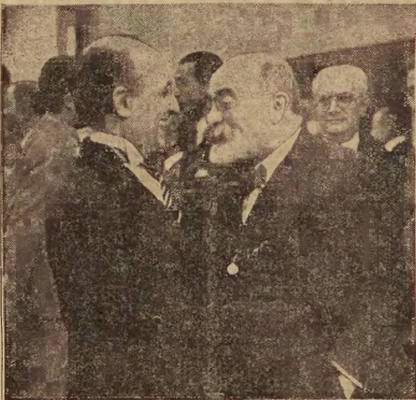
Rozmowa min. Barthou z przedstawicielem Hiszpanji w Genewie.

W dalszej debacie nad procedurą przeważała opinja Normana Davisa, że należy pozostawić czas na wymianę poglądów. Projekt utworzenia komitetu redakcyjnego temsamem chwilowo upadł. Prezydjum odroczyło się do piątku rana. Komisja główna zbierze się przypuszczalnie w piątek popołudniu.