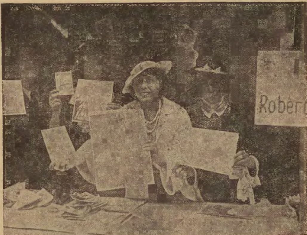
Mistinguette znana piosenkarka kabaretowa i tancerka sprzedaje programy na przedstawiskach.