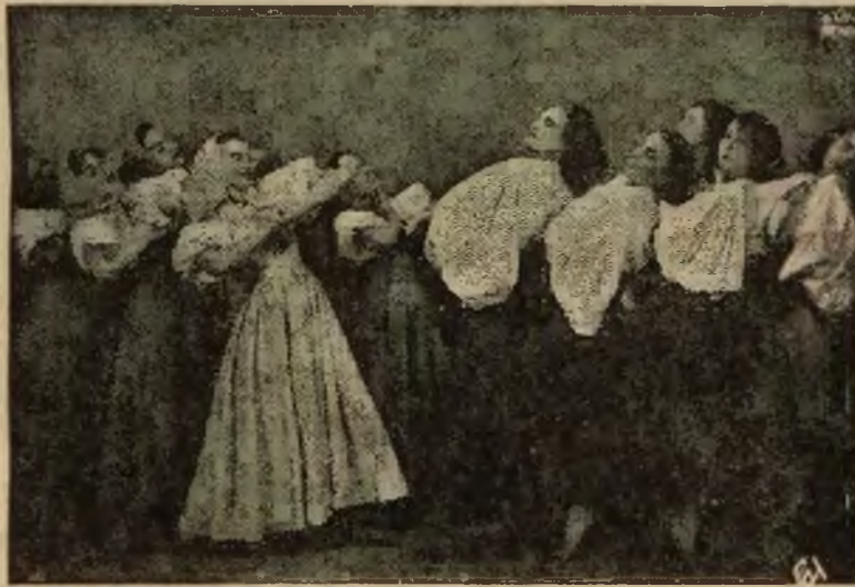
Odzianony I-szą nagrodą na Międzynarodowym Konkursie Tańca Artystycznego w Wied-