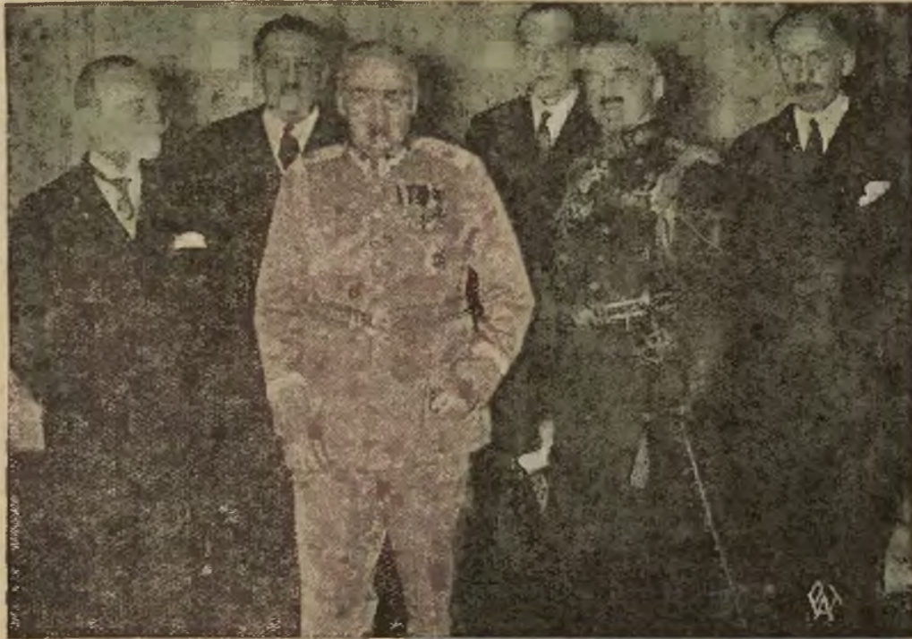
Pan Marszałek Piłsudski przyjął w poniedziałek po południu ambasadora nadzwyczajnego Belgji Adolfa Maxa. Zdjęcie przedstawia