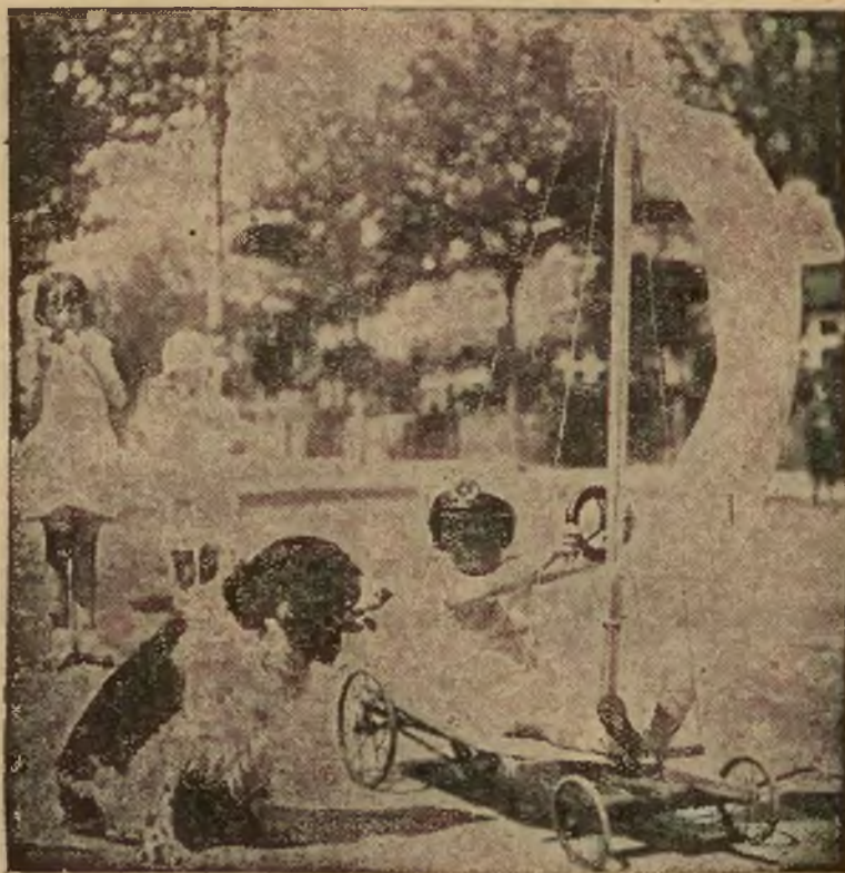
Czy możecie uwierzyć w to, że ta młodość sportu choć raz w życiu wygra Puchar Ameryki?