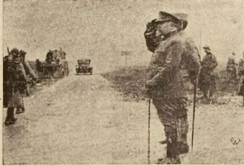
Na zdjęciu zmarły ostatnio b. prezydent Republiki Francuskiej Rajmund Poincare przypatruje się w towarzystwie marszałka Joffre'a przemarszowi wojsk w roku 1914-ym.