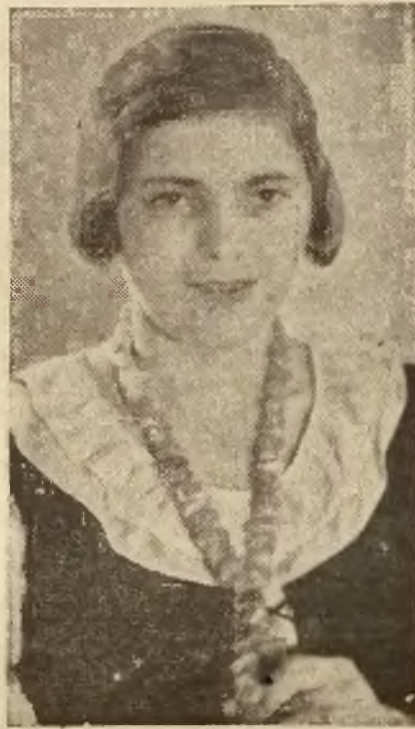
Na ilustracji młoda pani w naszym kraju, który własnoręcznie wykonała z ubieranych kawałków burstyn.