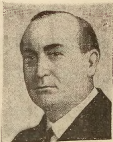
Premjer Węgier Gömbös.

Urodzony w 1886 r. we wsi Murga, w żupanstwie Tolna, pochodzi premjer Juljusz Goemboes ze starej szlacheckiej rodziny. Nauki pobierał w szkole wojskowej w Pecs, skąd wyszedł w 1905 r. i jako oficer przydzielony został do 25 pułku piechoty honwedów, stacjonowanego w Zagrzebiu. Po kilku latach służby wstąpił do wyższej szkoły wojennej w Wiedniu, gdzie w czasie studiów wygłosił referat, w którym wykazywał konieczność stworzenia samodzielnej armji węgierskiej.