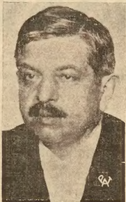
Min. Spraw Zagr. Laval.

z dziedziny polityki międzynarodowej. Konferencja ta miała na celu nawiązanie najściślejszego kontaktu ministra z reprezentacją parlamentarną, na której bezpośrednią współpracę liczy minister Laval.