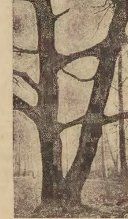
W parku w Siemianowicach pod Katowicami znajduje się niezwykle okaz przyrody czy też sztuki. Rosną tam nianowicie dwa drzewa, zrosnione ze sobą galziami.