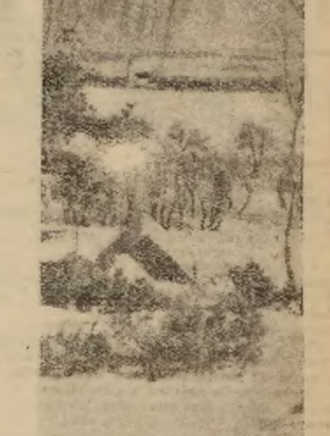
Ilustracja przedstawia widok na Staniom bogatęj i szacie zimowej. Dziś śniegi już stopniały.