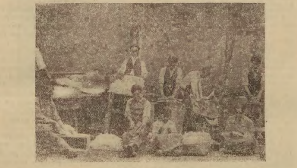
Do najbardziej popularnych gatunków przemysłu domowego w republikach środkowej i południowej Ameryki należy wyrob kapeluszy panamskich.