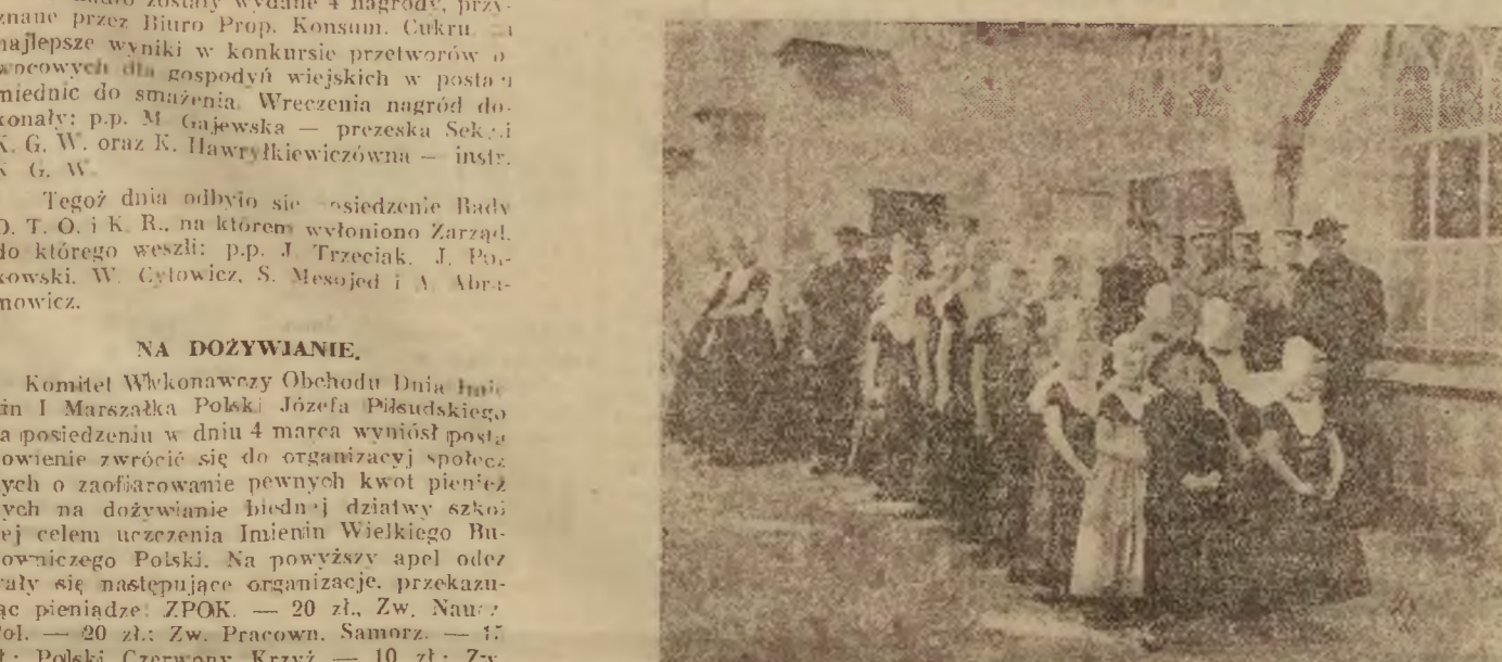
Na zdjęciu naszym widzimy grono dziewcząt holenderskich w charakterystycznych strojach ludowych z oryginalnymi przybraniami głowy, opuszczających kościoł.