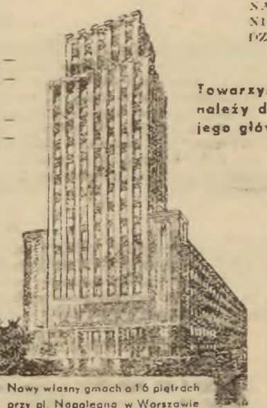
Nowy własny gmach o 16 piętrach przy pl. Napoleona w Warszawie

Czynności Dyrekcji Tow. „Prudential” na Polskę wykonywana Dyrekcją Tow. „Przezorność” w Warszawie, Plac Malachowski 4.