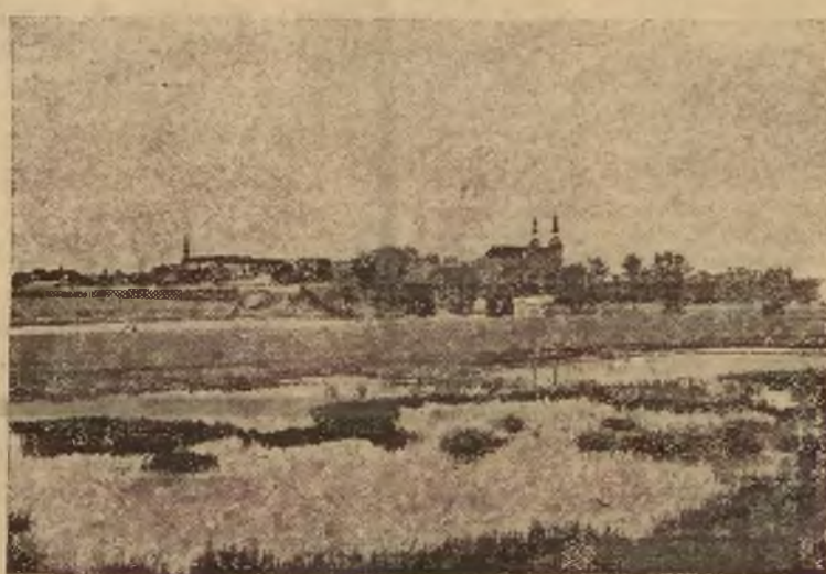
Zdjęcie przedstawia ogólny widok na Lewieć od strony rzeki Bzury. Na dalszym planie widać styną Kolegiatę Łowicką.

Na drodze między wsiami Kaczkowski i Grzeszaj piorun uderzył w stado 50-letniego pastuska i zabiło go. Pastuszek stracił mowę. W nocy tuż po burzy obudził się w domu pastuszek i znalazł w swoim pokoju 11 prosiaków oraz ciężko kaleczącego pastuska. Pastuszek stracił mowę.