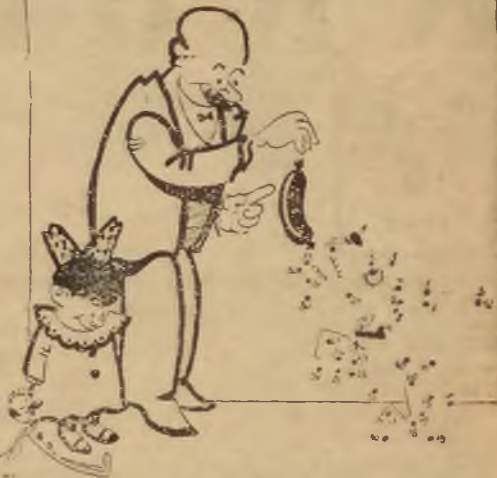
Punkty połączone linją prostą w kolejności jak wskazują cyfry.

Ruch turystyczny we wszystkich krajach skutkiem przesilenia gospodarczego znalazł się w ciężkiej sytuacji. Nasz zagraniczny ruch turystyczny wskutek ograniczeń paszportowych zmniejszył się bardzo wydatnie. Należałoby jednak umożliwić warstwom mniej zamożnym wyjazd choć na krótki czas z dusznych murów miasta. Tutaj dużą przeszkodą jest dość wysoka stosunkowo taryfa pasażerska. Przy wyjazdach na czas dłuższy nie odgrywa to wielkiej roli, o ile jednak wyjazd trwa krótko, jeden lub dwa dni, a czasami zaledwie parę godzin koszt przejazdu staje się nieproporcjonalnie wysoki w porównaniu z krótkotrwałą przyjemnością uczestnictwa w parze szybkości pociągu.