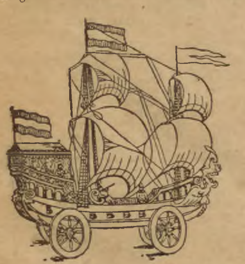
Wóz pomysłu Stevina (1599 r.).