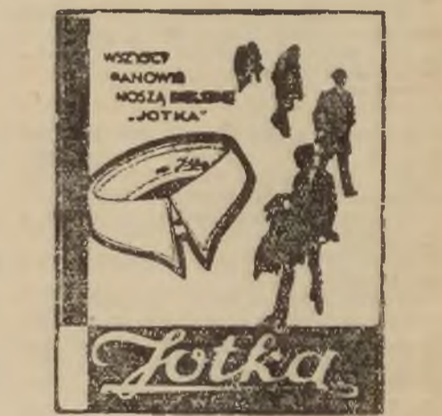
Do nabycia w pierwszorzędnym magazynach galanterijnych.