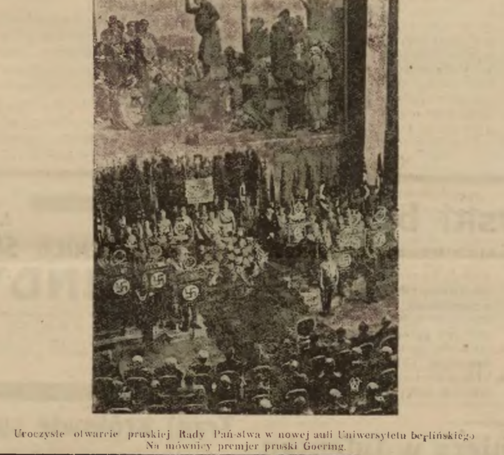
Uroczyste otwarcie pruskiej Rady Państwa w nowej uli Uniwersytetu berlińskiego. Na mównicy premier pruski Goering.