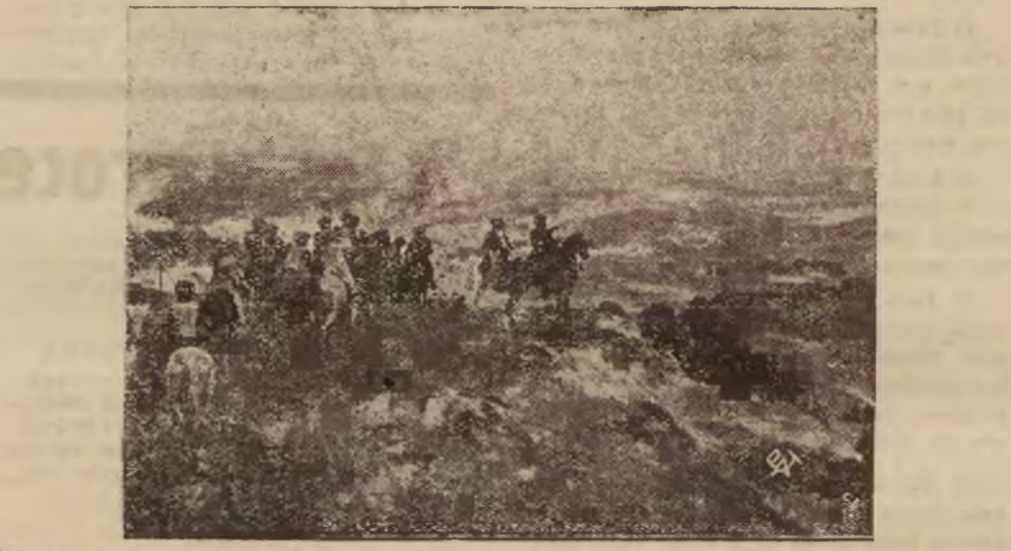
Muzeum Narodowe w Brukseli posiada w swych zbiorach obraz wielkich rozmiarów pedzla wybitnego współczesnego malarza belgijskiego Enlla Wautersa...