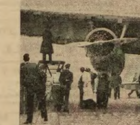
Pierwszy samolot o składanym podwoziu, celem zmniejszenia oporu powietrza, został skonstruowany w Holandji.