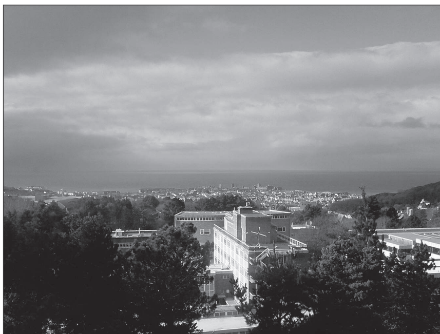
1. Widok z okien Biblioteki Hugh Owen na zatokę Cardigan

Biblioteka składa się z trzech pięter/poziomów: D, E i F. Na parterze znajduje się poziom D, na którym umieszczone zostały kolekcje podręczników, nowych nabytków, czasopism, literatury współczesnej, beletrystyki oraz kolekcja płyt DVD. Tutaj także znajduje się główny punkt informacyjny (Biuro Obsługi Klienta), służący użytkownikom pomocą we wszystkich sprawach związanych z korzystaniem z całego systemu informacyjnego Uniwersytetu. Na poziomie D ulokowane zostały także urządzenia do samodzielnego wypożyczania zbiorów, zwrotów, płacenia ewentualnych kar oraz doładowywania Aber Karty. Ciekawostką jest fakt rozmieszczenia na dywanowych wykładzinach – obok tradycyjnych stołów i krzeseł – miękkich pufów praktycznie służących do leżania. W takiej pozycji można również delectować się wziętą z półki lekturą.