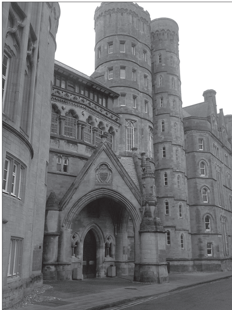
3. Old College

Nasz pobyt w Uniwersytecie Aberystwyth nie polegał tylko na zaznajamianiu nas przez bibliotekarzy z pracami prowadzonymi przez Bibliotekę. Niewątpliwie najprzy- jemniejszym punktem naszego szkolenia była wizyta w Old College.