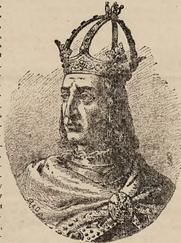
Рудольфъ зъ Габсбурга.

Такъ ся и стало. Рудольфъ товаришивъ Вернеру до Риму и назадъ, а Вернеръ пбзнавъ характеръ графа достаточ- но, — бнъ пересвѣдчивъ ся о его храбрости и лагодности, о его мудрости, и запамятавъ его собѣ добре. Коли же въ Нѣмеччинѣ не стало уже цѣсаря, бо цѣсарска рѣдина вымерла, тогды треба було выбирати нового цѣсаря. Збйшли ся великй паны, що мали право выбирати, а межк ними бувъ такожъ Вернеръ. Той пригадавъ собѣ Рудольфа и предложивъ его на цѣсаря, а коли оповѣвъ всѣмъ о его характерѣ и ѳтбмъ, що въ его краю тихо, бо бнъ умѣ пановати, такъ всѣ згодили ся на