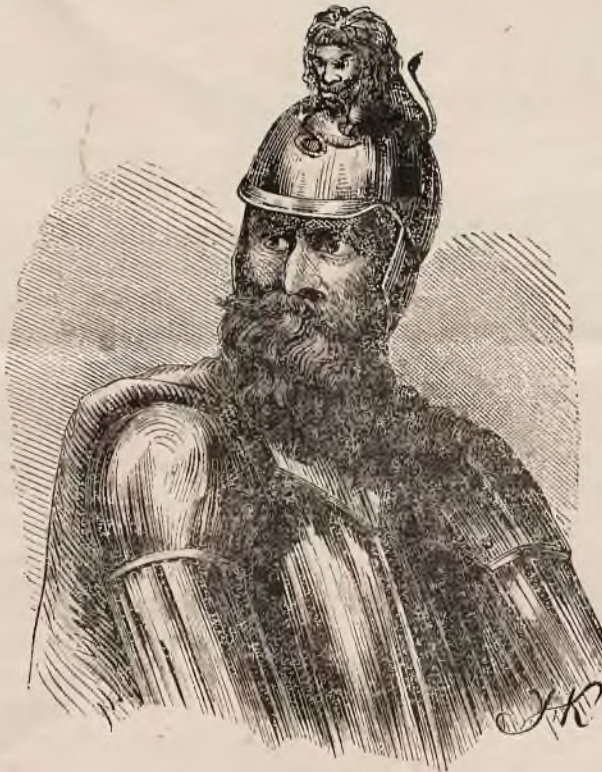
Князь Романъ Мстиславичъ.

теля для марнов мамоны свѣтовон. Будьте твердого характеру, не колибайте ся въ житю вашомъ въ постоянности своей, та щобы други не помѣтовали вами и не держали васъ за своихъ набметѣвъ, не смѣяли ся зъ васъ и не почитали за пѣдлыхъ ренегатѣвъ, за зрайдцѣвъ и продайникѣвъ самого себе и своего народа. Все тѣи, которіи дадутъ ся оманити противнымъ науками, блескомъ фалшивон славы, и надеждами на якіи собствении користи, суть лишъ Юдами, которіи колясь такой прѣйдутъ до пѣнанія сво-