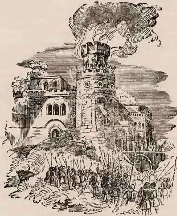
Нападъ Литовцевъ на Кієвъ.

Якійсь часъ бувъ супокій въ краю, и Юрій зачавъ роздумовати надъ его добромъ, ажъ тутъ и Литва, маленька краинна надъ рѣ- кою Нѣмною, що то рускимъ князямъ дань платила, що то рускому народови помагала би- ти ся, загадала тешеръ сдѣлатись особнымъ