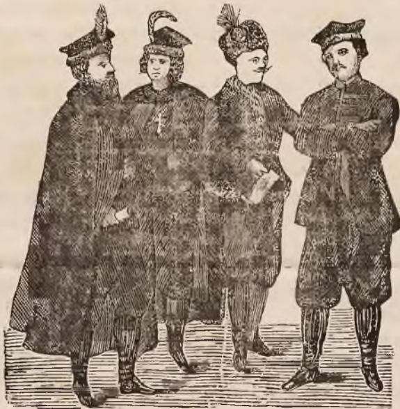
1. Коронарь (житель зъ Конгрисбвки), — 2. Краковянинъ (житель зъ Кракова), — 3. Литвинъ (житель зъ Литвы), — 4. Великополянинъ (житель зъ Великопольщи).