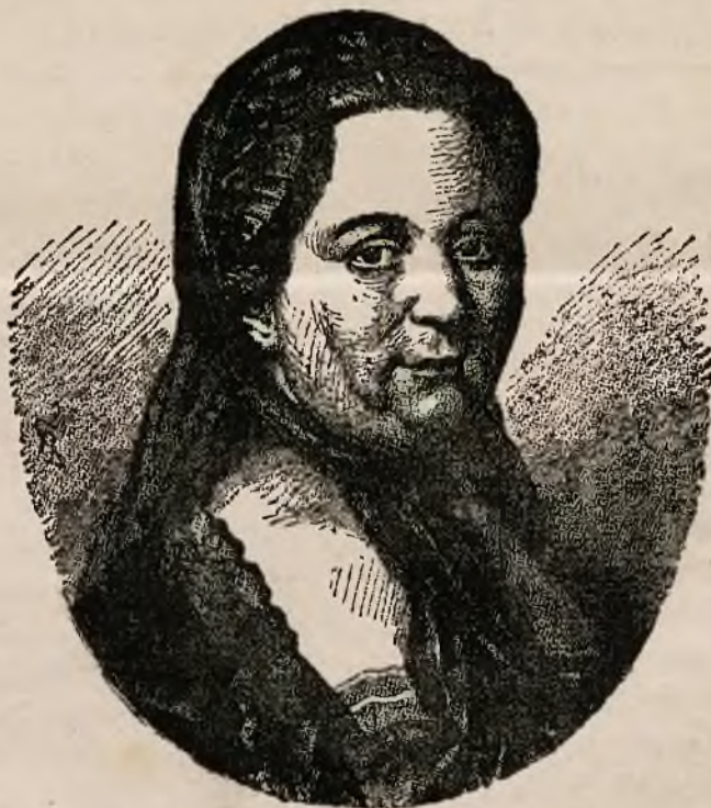
Цѣсарева Марїа Тереса.

— Вы дѣтоньки уменьшили менѣ працѣ, — сказавъ Онуфрїй, коли побачывъ, що Михасъ уже перейшовъ съ хлопцами въ коротцѣ цѣлу исторїю; — и я могу теперъ вамъ дальше оповѣдати. Не много буде вже того, бо днесъ хочю закѣнчити мои росказы. Въ правдѣ кѣнчить ся исторїя Руси на князю Болеславѣ Тройденовичу (1339), бо ѣтъ того часу перейшла Русь пѣдъ панованье польскихъ королѣвъ, пѣдъ которыми Русинамъ не коньче добре було. Но и не навѣки мы зѣставали пѣдъ Польщю, бо лишъ до р. 1772. Коли король Собьескїй умеръ, але дѣяло ся въ краю.