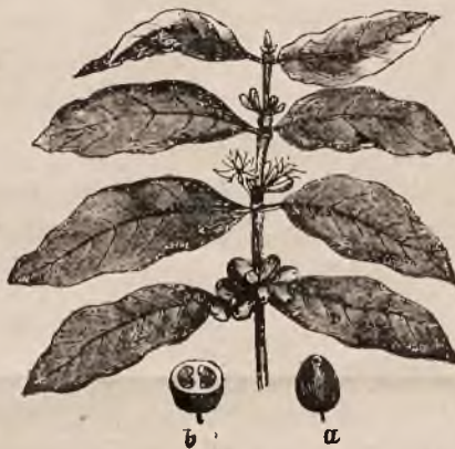
Галузка дерева кавового. а. овочъ. — б. овочъ перетятѣи.

Кава мѣрно уживана не есть шкѣдлива здоровому чловѣкѣи, однакожь надмѣрно уживана и мѣчна кава справляе битѣе крови до головы, трясенѣе рукъ и всѣлякии хоробы нервовѣи, а даже опомороченѣе и парализѣе. Въ онѣмъ именно товариствѣи въ Берлинѣи, якъ писали недавно газеты, ишла бесѣда о кавѣ. Онѣи казалѣи, що кава есть отруею, другѣи перечили; а коли пѣишло о закладѣи, тогды онѣи зъ присутствующихъ, будовничѣи, заявивъ, що онѣи готовъ попробувати на собѣи дѣланѣе кавы. Въ очяхъ цѣлого товариства праладжено ему зъ \frac{1}{4} кильо найлѣпшой Мокка малу филѣжанку мѣчной черной кавы, котру онѣи охочо