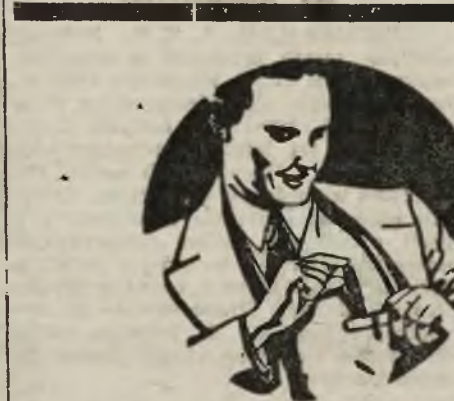
W TYM ROKU POSŁUGUJ CIB