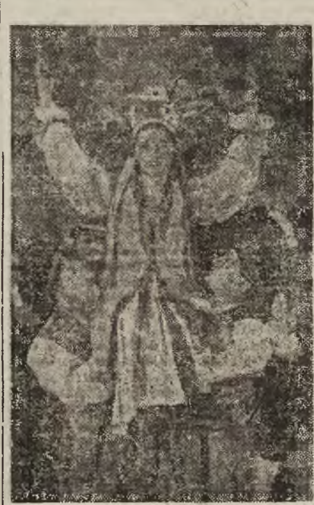
W TYM ROKU POSŁUGUJ CIB

Zeznania te należy złożyć u lekarza weterynarii w Wilnie (W. Pohulanka 24, II piętro, pokój nr 12) w godzinach od 8 do 14 i pół.