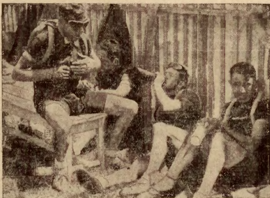
Skromne śniadanie uczestników największych i najtrudniejszych zawodów kolarskich świata, „Tour de France“. Na zdjęciu widzimy Belga Maes (na lewo), który prowadzi w zawodach i jego towarzyszy podczas krótkiej chwili odpoczynku na jednym z etapów tych gigantycznych zawodów.