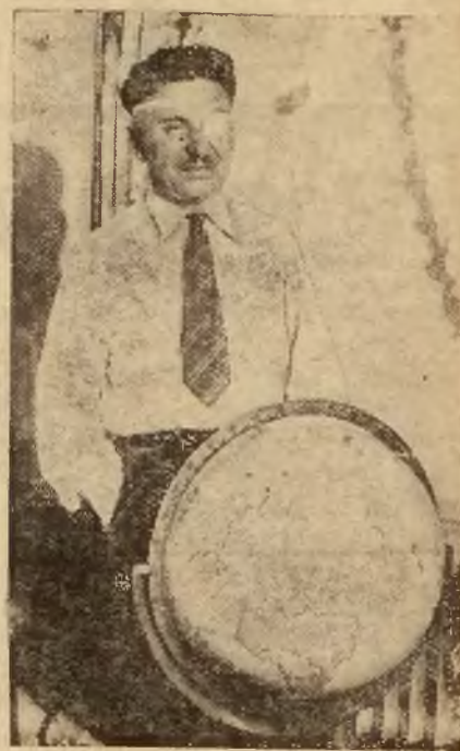
Świetny lotnik amerykański Willy Post, który po nieudanym starcie po raz drugi wystartował do gigantycznego lotu ponad biegunem, uległ wypadkowi w okolicach Pół Barrow, najdalej wysuniętej na północ osady białych w Ameryce. Post zginął wraz ze swoim towarzyszem, znakomitym aktorem Willy Roggersem.