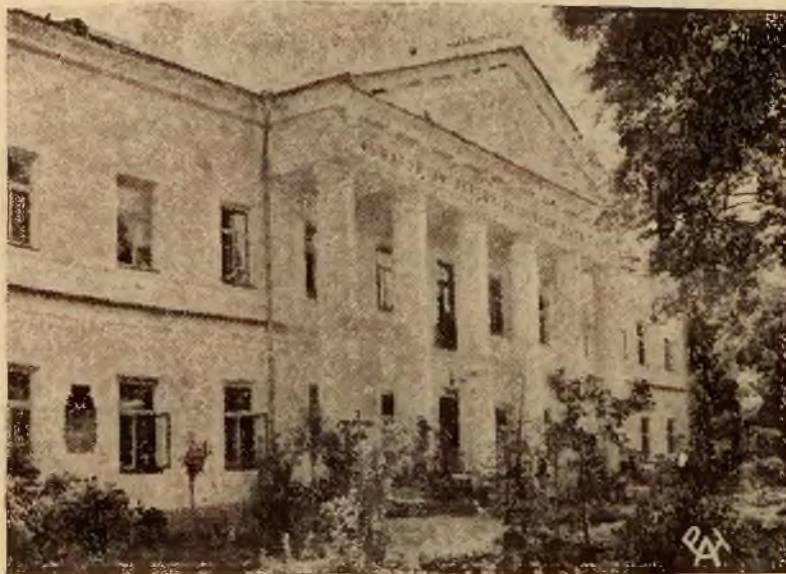
Fronton głównego pawilonu na otwartych w dniu 16 b. m. w Równem Targach Wołyńskich.