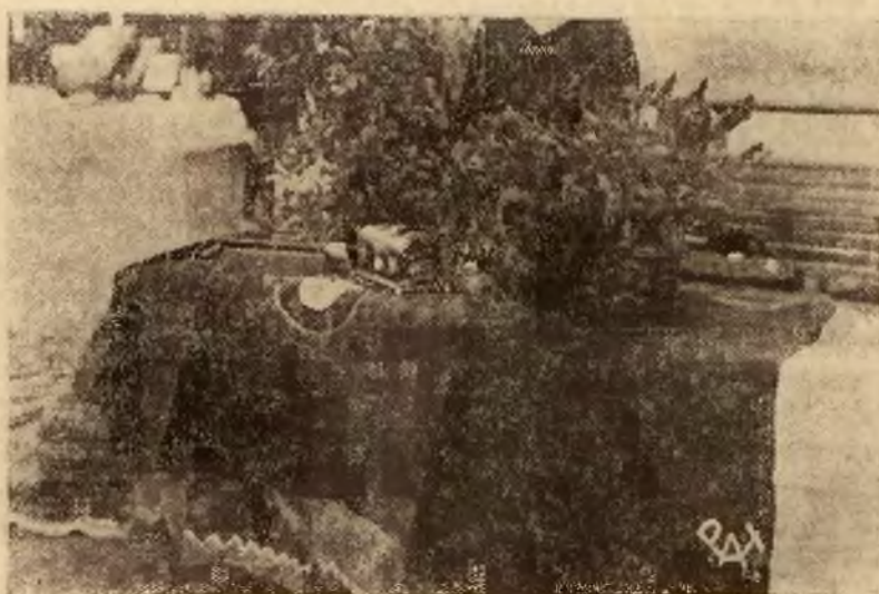
Przywieziona na M/S „Piłsudskim” szkatuła, zawierająca ziemię z Madery i historycznych pobożowisk przeznaczona na Kopiec Józefa Piłsudskiego na Sowińcu.

w okresie świąt Bożego Narodzenia — opłatek dla członków i choinkę dla biedniejszych dzieci ze wsi, 22 stycznia — obchód powstania Stęczyńskiego, 1 lutego — imieniny Pana Prezydenta Mościckiego, 19 marca — dzień imienia Pierwszego Komendanta (jeśli inne zarządzenia nie zostaną wydane), w okresie świąt Wielkanocnych — święcone, 12 maja — dzień śmierci Pierwszego Komendanta i Pierwszego „Mrszałka Polski”, 6 sierpnia — Święto organizacyjne. Wszystkim obchodom nadać należy inny niż dotychczas charakter. Każdy obchód, przypominający zawsze jakiś czyn, dzieło lub pracę — czynem naszym musi być uczczony. W dniu takich rocznic zdobyć się musi każdy nasz pododdział na jakąś pracę dla dobra środowiska i państwa. Chodzi tu bardziej o pracę taką, na jaką stać daną jednostkę, jaka w danych warunkach jest pożądana.