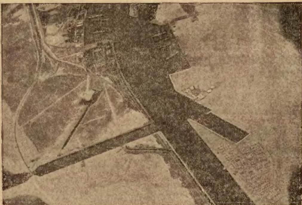
W związku z coraz bardziej rosnącym prawdopodobieństwem wojny włosko-abisyńskiej, kwestja użytkowania kanału Sueskiego zaprzęta umysły polityków i dyplomatów. Nasza ilustracja przedstawia widok kanału z lotu ptaka w pobliżu miasta Suez, uważanego za wrota do Morza Czerwonego.