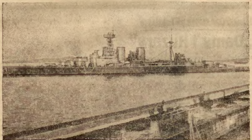
Na zdjęciu o'brzymi pancernik angielski „Hood” (42.000 ton), przepływa przez cieśninę Gibraltarską.

Doniosłe znaczenie Gibraltar jako punktu strategicznego podkreśla obecnie koncentracja floty wojennej W. Brytanii. W porcie znajdują się już m. in. 3 największe wojenne okręty Anglii m. in. „Hood” okręt — twierdza o pojemności 42.000 tonn. T. T.