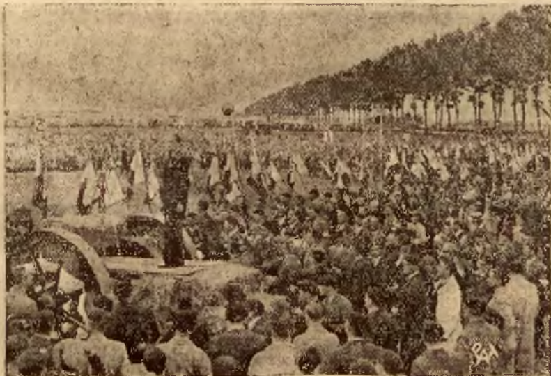
Członkowie francuskiej organizacji Croix de Feu odbyli w tych dniach masowe zbiórki w 9 punktach Francji. Na zdjęciu — wódz organizacji Croix de Feu ptk. de la Rocque, wygłasza przemówienie do członków organizacji.