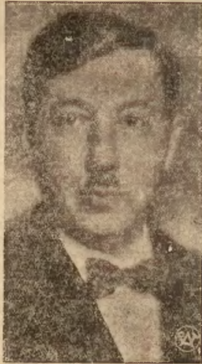
Wicepremier i min. Skarbu Eugeniusz Kwiatkowski.

stersstwa spraw wewnętrznych i spraw zagranicznych. Podkreślić należy, co nie budziło zresztą wątpliwości, że kierownictwo polityki zagranicznej pozostało w rękach utalentowanego współpracownika Marszałka Piłsudskiego w tej dziedzinie, Min. Becka. Ministerstwo Spraw Wewnętrznych objął natomiast p. Wł. Raczkiewicz, doświadczony i umiejętny administrator, popularny w Wilnie z po-