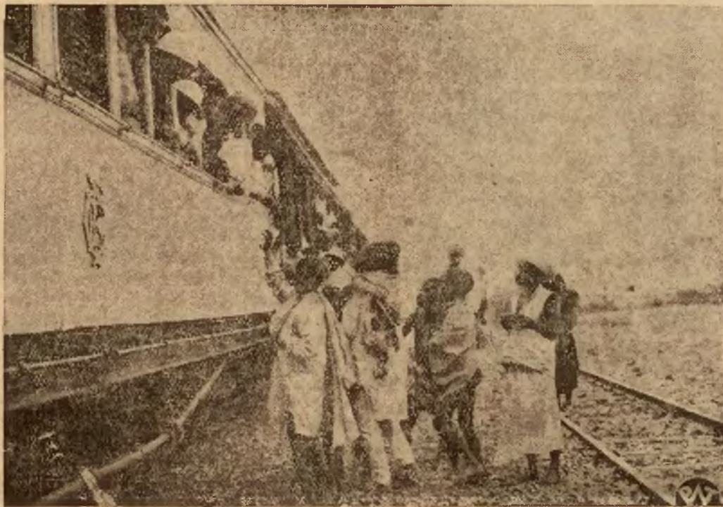
Kupcy etiopscy opuszczają Addis Abebę w obawie przed atakiem lotniczym i możliwością unieruchomienia jedynej linii kolejowej łączącej stolicę Etiopii z zagranicą.