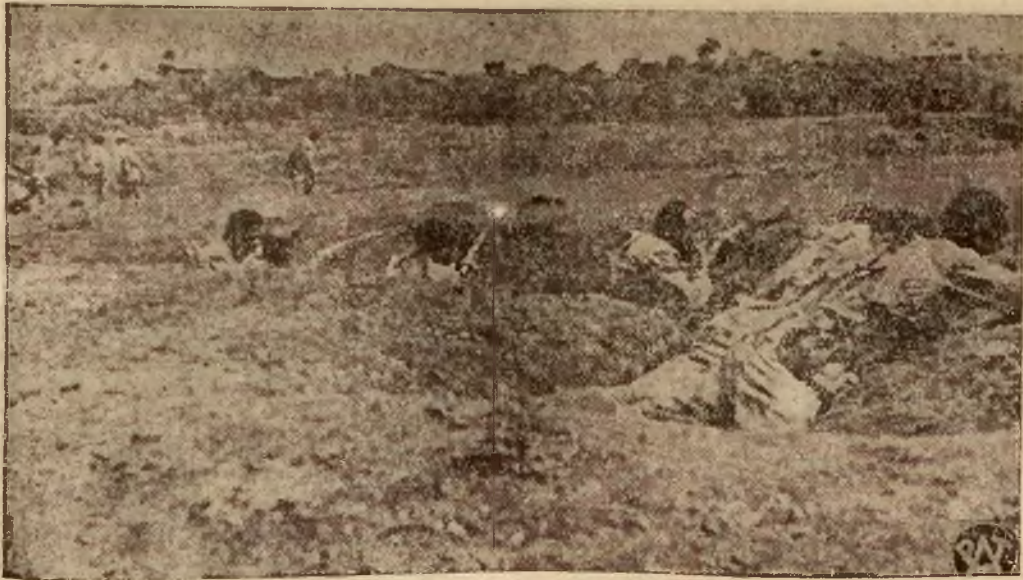
Na pierwszej linii frontu. Oddziały piechoty abisyńskiej w prymitywnych okopach.