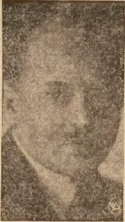
Premier Marjan Zyndram—Kościalski.

Jest nim nieobecność w nowym Rządzie Marszałka Piłsudskiego, którego niezastąpiony indywidualny autorytet był dla każdego z poprzednich gabinetów niezawodną rezerwą