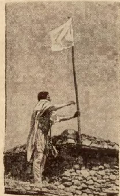
Abisyńczycy poddają się. Żołnierz abisyński na murach jednego z miast między Adigrat i Makalle wywiesza białą chorągiew na znak poddania się Włochom.