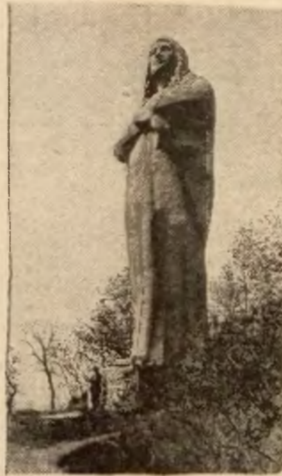
Pomnik Indianom. W Illinois w Ameryce został odsłonięty ten pomnik na pamiątkę pierwotnych mieszkańców tego kraju. Indian, których wyparli biali i skazali tę rasę na zagładę.