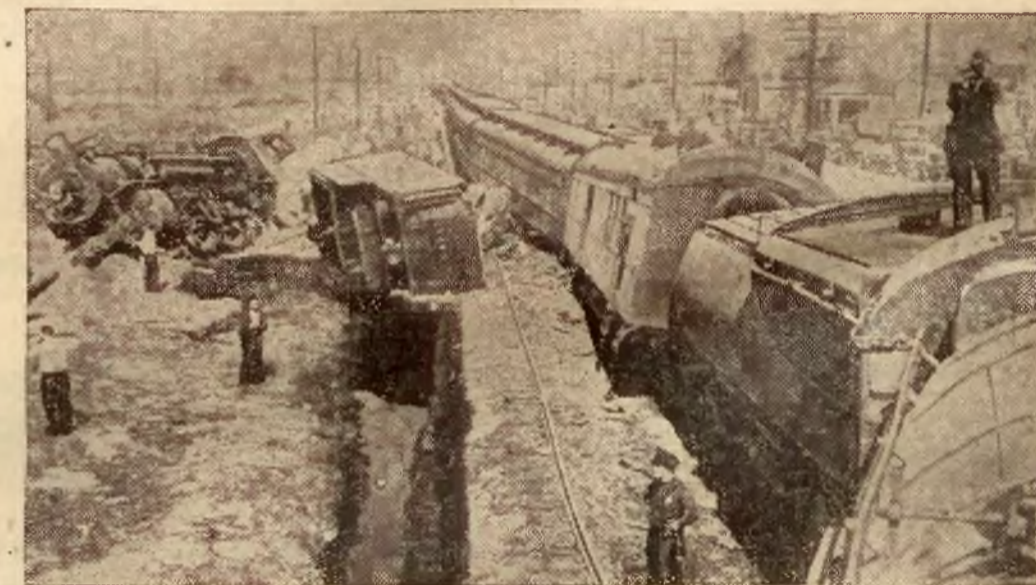
Katastrofa kolejowa. W pobliżu Glendale w Kaliforniji pociąg pociąg zderzył się z pociągiem towarowym. Obie lokomotywy i wiele wagonów stoczyło się z nasypu. Cztery osoby zginęły. Na ilustracji — nieuprzątnięty jeszcze teren katastrofy.