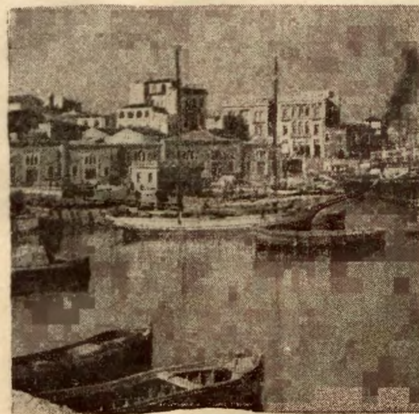
Niespokojna prowincja grecka. Widok wyspy Krety, na której ostatnio miały miejsce rozruchy, z portem Kandja, głównem miastem wyspy.