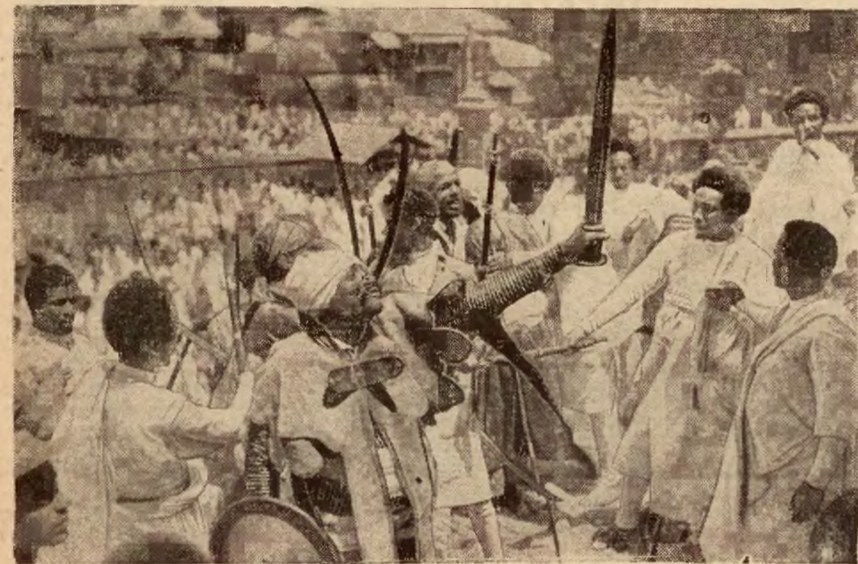
Zapał wojenny Abisyńczyków. Niedawno 20.000 wojowników abisyńskich z różnych stron kraju w drodze na front przemaszerowało przed pałacem cesarskim w Addis Abebie. Na ilustracji — wojownicy wznoszą okrzyki w zapale wojennym.