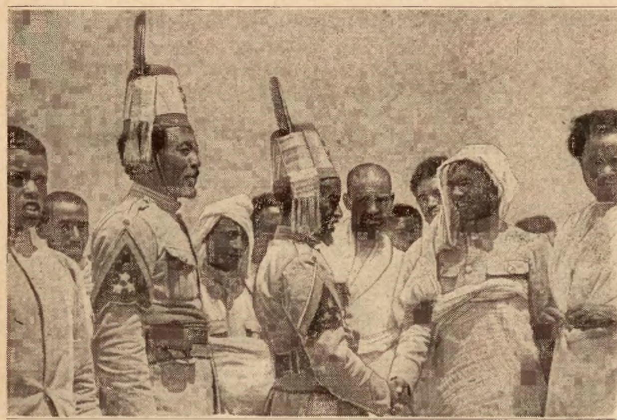
Wojna w Abisynji. Żołnierze włoskich, którzy stanowili wartę przy poselstwie włoskiem w Addis Abebie, zamienili żołnierze abisyńscy. Na zdjęciu — Abisyńczycy witają się z tubyleczymi żołnierzami włoskimi