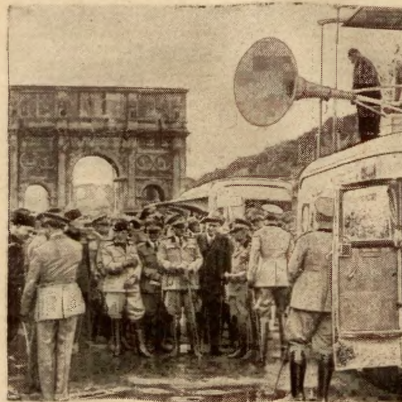
Włoska propaganda przeciw wojnie gazowej. Podczas gdy podług wiadomości z teatru działań wojennych znalazły tam zastosowanie chemiczne środki walki, we Włoszech rozpoczęła się wśród ludności kampanja przeciw broni chemicznej. Na ilustracji — fragment z przebiegu kampanji w Rzymie.