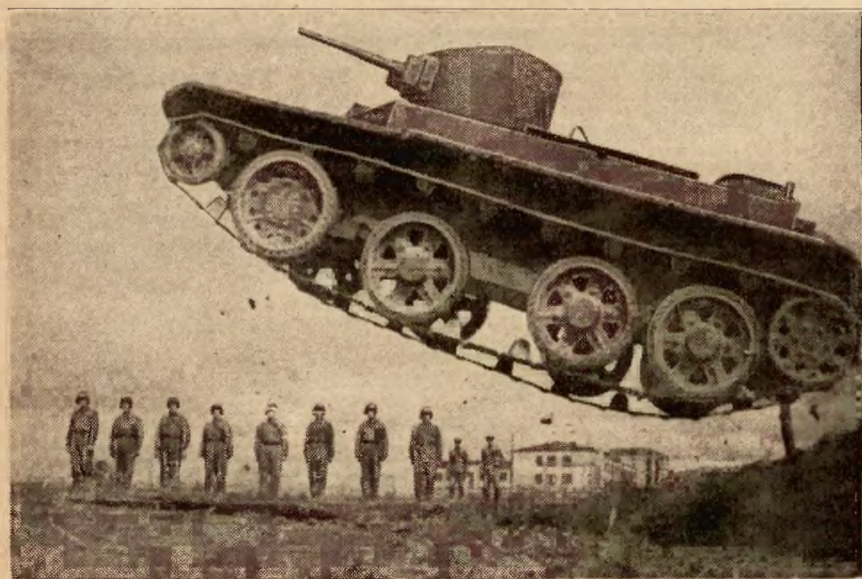
Skaczący czołg. Dla nowoczesnych czołgów nie istnieją żadne przeszkody. Czołg, jaki ostatnio skonstruowano w armji sowieckiej dosłownie skakał do góry pokonywując przeszkody podczas ostatnich ćwiczeń wojskowych w Sowieciech.