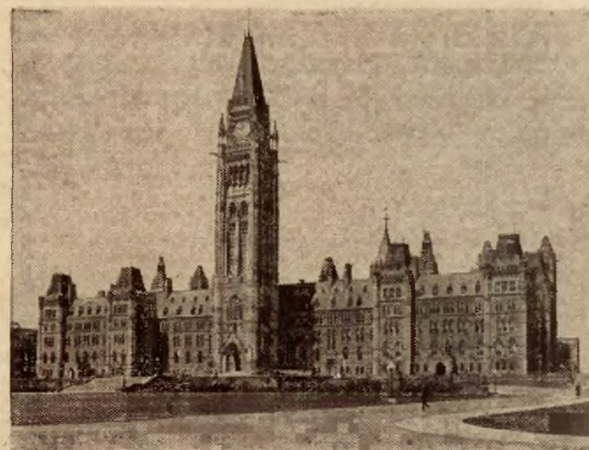
Wybory w Kanadzie. Parlament w Ottawie, gdzie w wyborach liberali otrzymali większość zwyciężając konserwatystów.