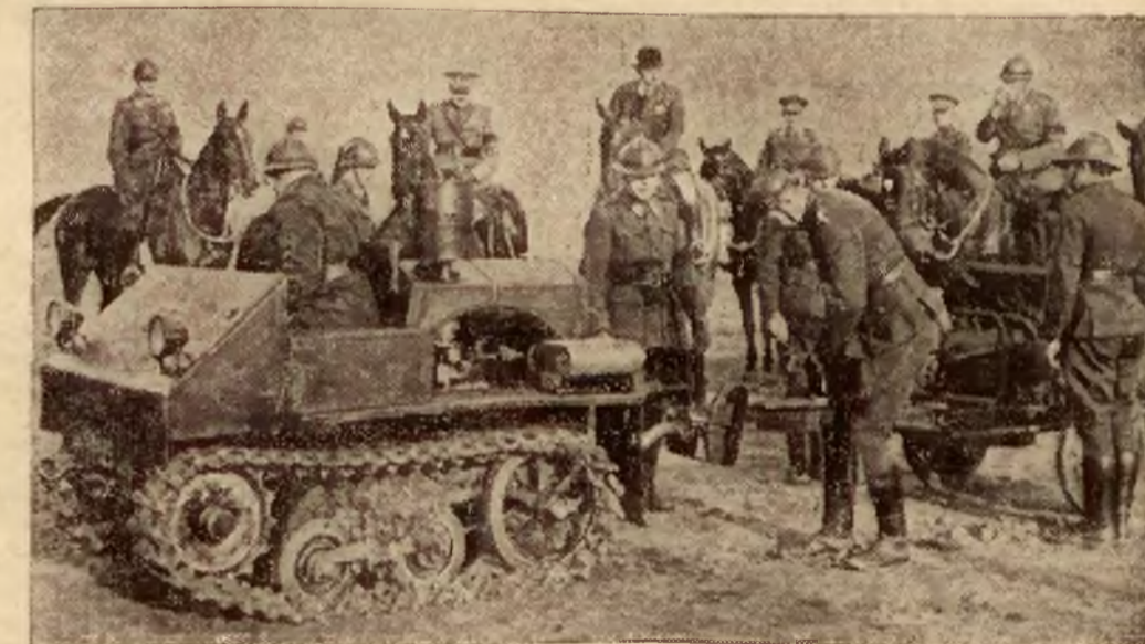
Motoryzacja artylerji belgijskiej. Belgijski minister wojny przed kilku dniami dokonał inspekcji nowo-uruchomionej baterji, ciągniętej przez specjalne czołgi. W najbliższym czasie w podobny sposób ma być zmotoryzowana cała artylerja belgijska. Na zdjęciu — minister ogląda nowy czołg artyleryjski.