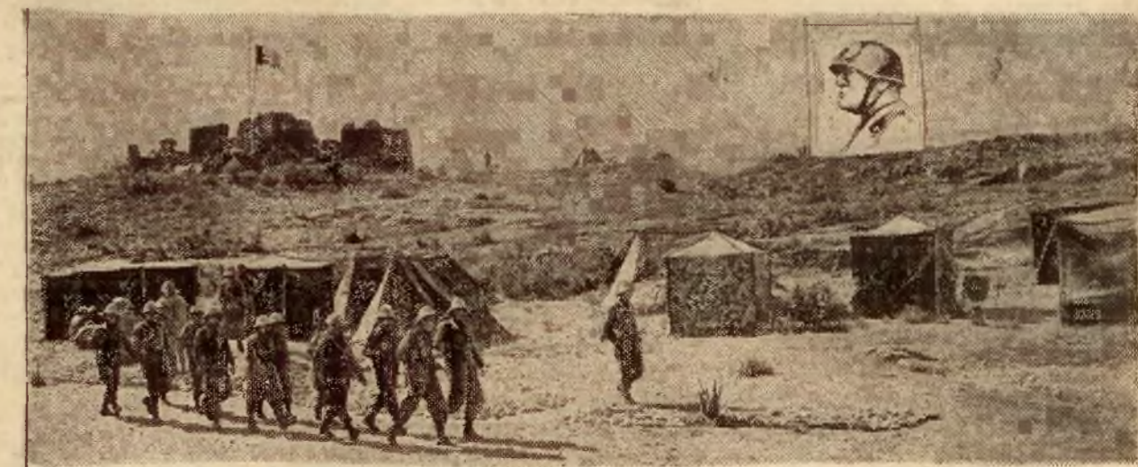
Z terenu walk w Abisynji. Włoski obóz wojenny w pobliżu Adigratu na froncie północnym. Nad obozem góruje olbrzymich rozmiarów portret Mussoliniego.