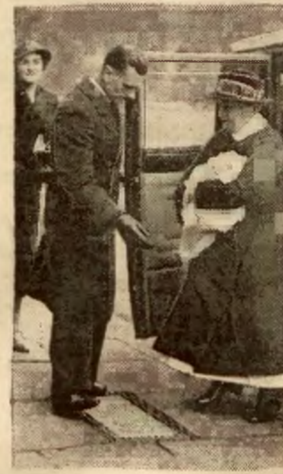
Pierwsza fotografia syna księcia Jerzego i księżniczki Maryny. Książę w towarzystwie swej świty powraca ze spaceru do swego mieszkania w Londynie.