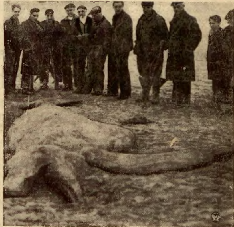
Na plaży pomiędzy Souleć i Lamalie les Bains znaleziono wyrzuconego przez morze olbrzymich rozmiarów potwora morskiego. Długość jego wynosi 6 metr., ma on olbrzymie paszczęki zaopatrzone w silne uzębienie, posiada dwie płetwy długości około 1 metr. 20 cm. Waży on 3 tony. Rzadki ten okaz fauny morskiej należy do ssaków. —