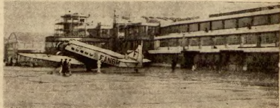
Jak widzimy ze zdjęcia prace przy nowym porcie lotniczym w Bourget są na ukończeniu. Częściowo nawet od dany jest on do użytku.