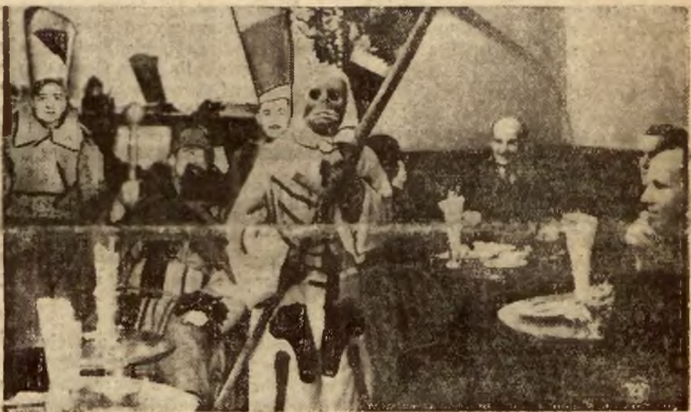
W dniu 6 bm. tradycyjnym zwyczajem mieszkańców stolicy odwiedzali koledziacy z szopkami. Na zdjęciu naszym widzimy w jednym z lokali warszawskich poprzehierane diabły. Króla Heroda oraz śmierć z kosa.