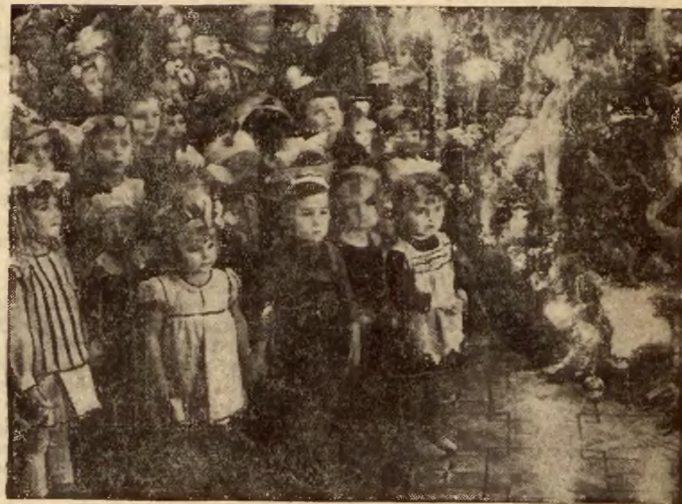
Onegdy pod tradycyjną choinką zebrała się w sali Rady Miejskiej w Warszawie dziesiątka pracowników. Choinka złożona z kilku drzewek i pięknie przybrana sięgała pod sufit. Po odśpiewaniu koledż nastąpiło rozdanie upominków. Zdjęcie nasze przedstawia najmłodszą dziesiątkę, która przed zapaloną choinką ogląda się za stołem z prezentami.