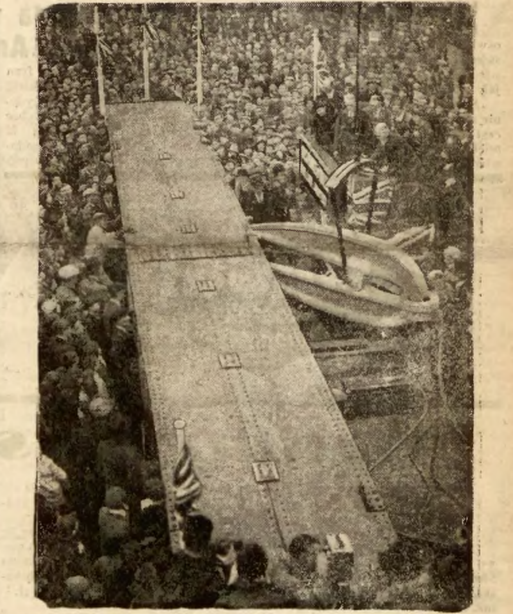
W stoczni w Birkenhead (Anglia) przystapiono do budowy nowego olbrzymiego pancernika „Prince of Wales“. Pancernik, najwiecej na świecie, bedzie kosztował siedem milionów funtów szterlingow.