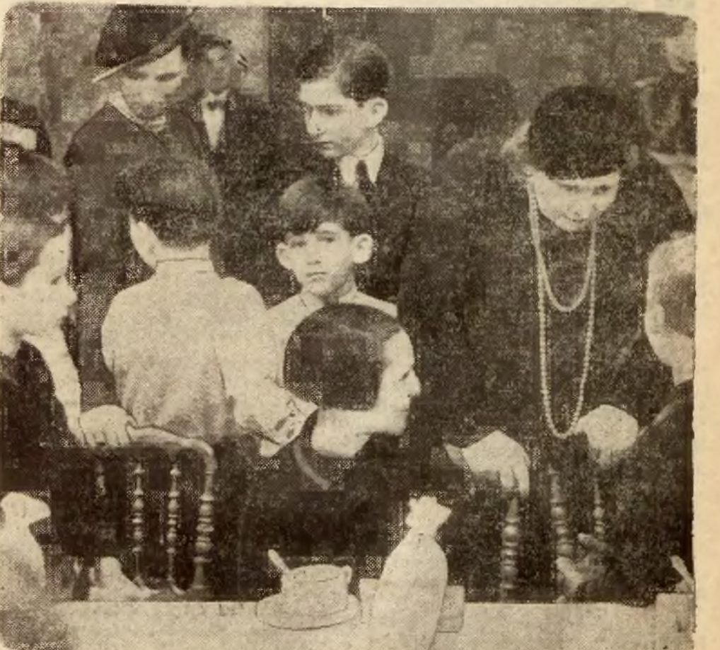
Król jugoslawiański, Piotr II, wraz ze swymi braćmi Tonislawem i Andrzejem przyjmują na Nowy Rok w swym zamku w Belgradzie biedne dzieci. Na prawo krolowa Maria rozmawia z jednym z młodych gości.