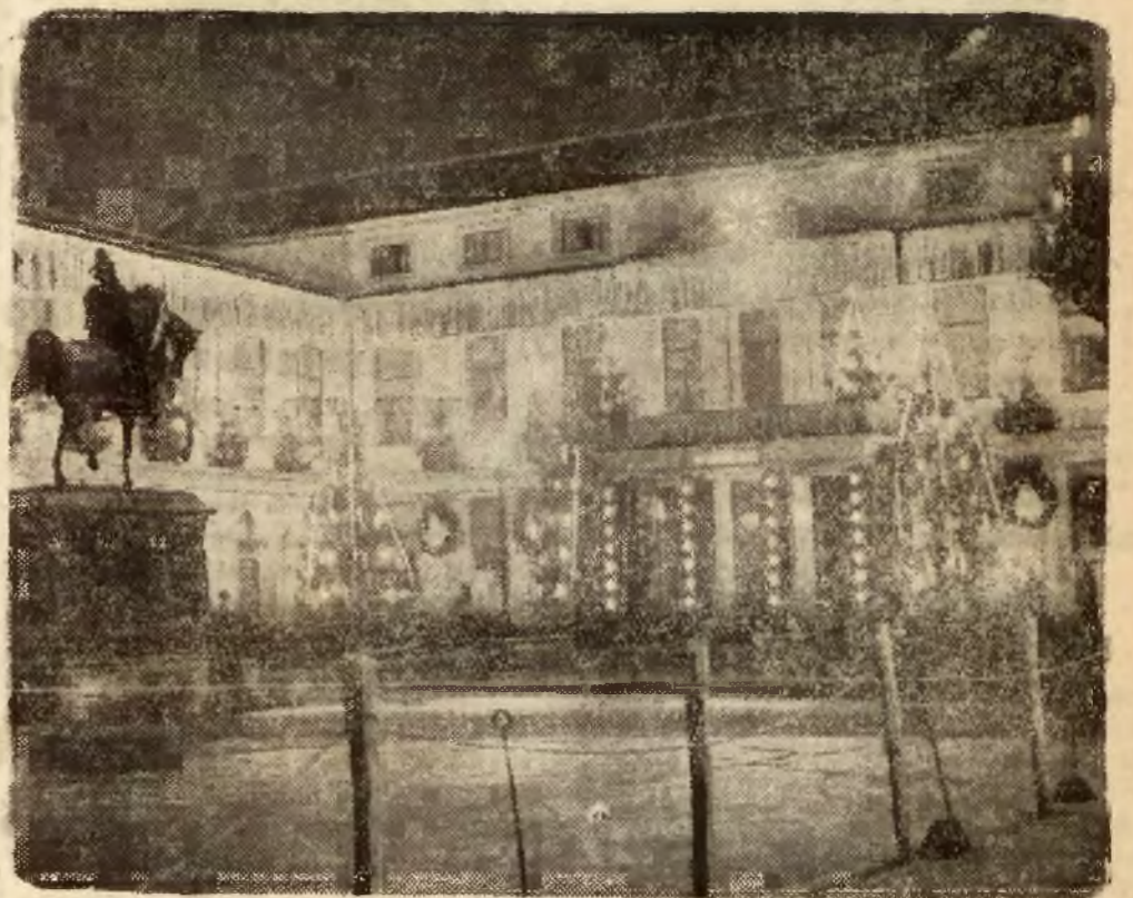
Zamek w Hadze, wspaniale iluminowany na zakończenie uroczystości weselnych.