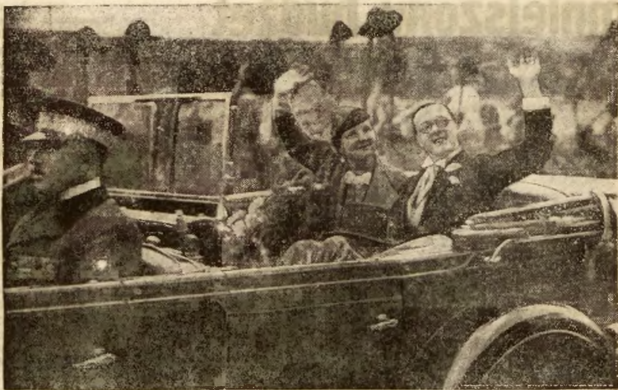
księżniczka Juliana oraz książę Bernhard są owacyjnie witani przez tłumy publiczności.