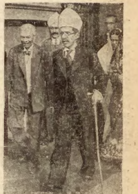
Książę Hydebaradu, uważany za najbogatszego człowieka świata opuszcza Muzeum Indyjskie w Kalkucie, gdzie był obecny na otwarciu akademii sztuki.