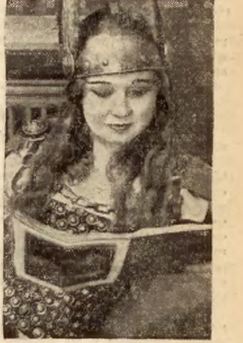
Słynna opera Metropolitan w Nowym Jorku otworzyła 52 sezon znaną operą „Walkiria" Wagnera. Na zdjęciu — jedna z od-twórczyni roli Walkirii.