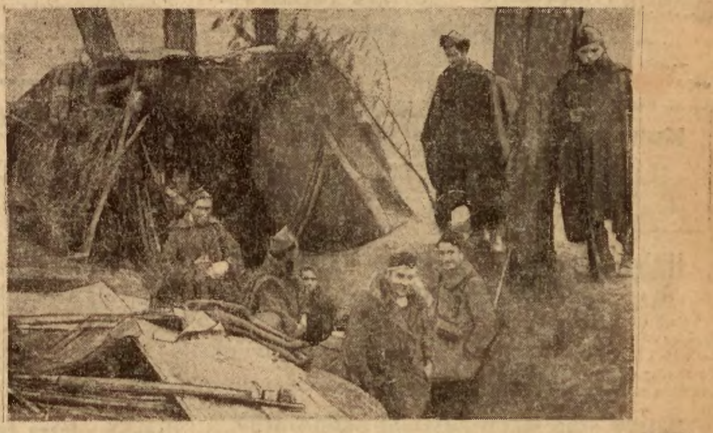
pozycja wojsk powstańczych pod Madrytem.