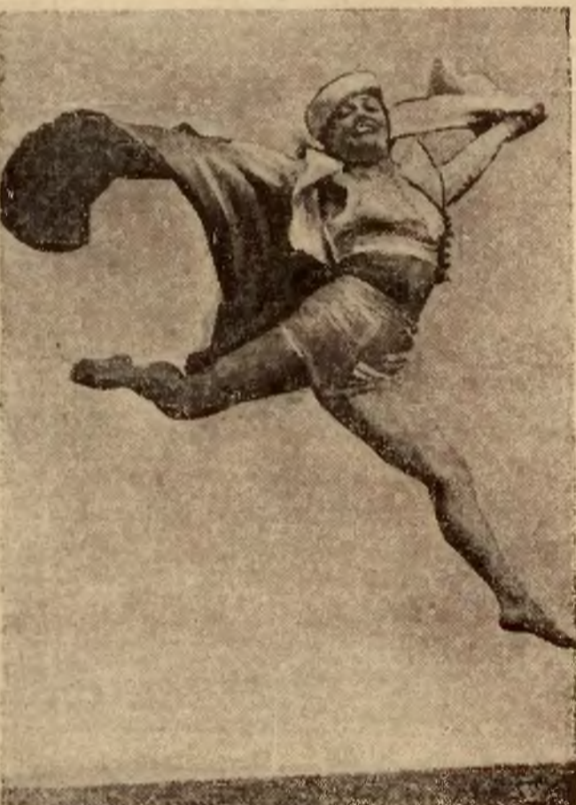
Oryginalne zdjęcie przedstawiające jedną z figur niezwykle tanca, tańczącego w Kalifornii. Figura ta, w której taneczka wykonano ewolucję w powietrzu, została ochrzczona nazwą „tańca wielorów”.