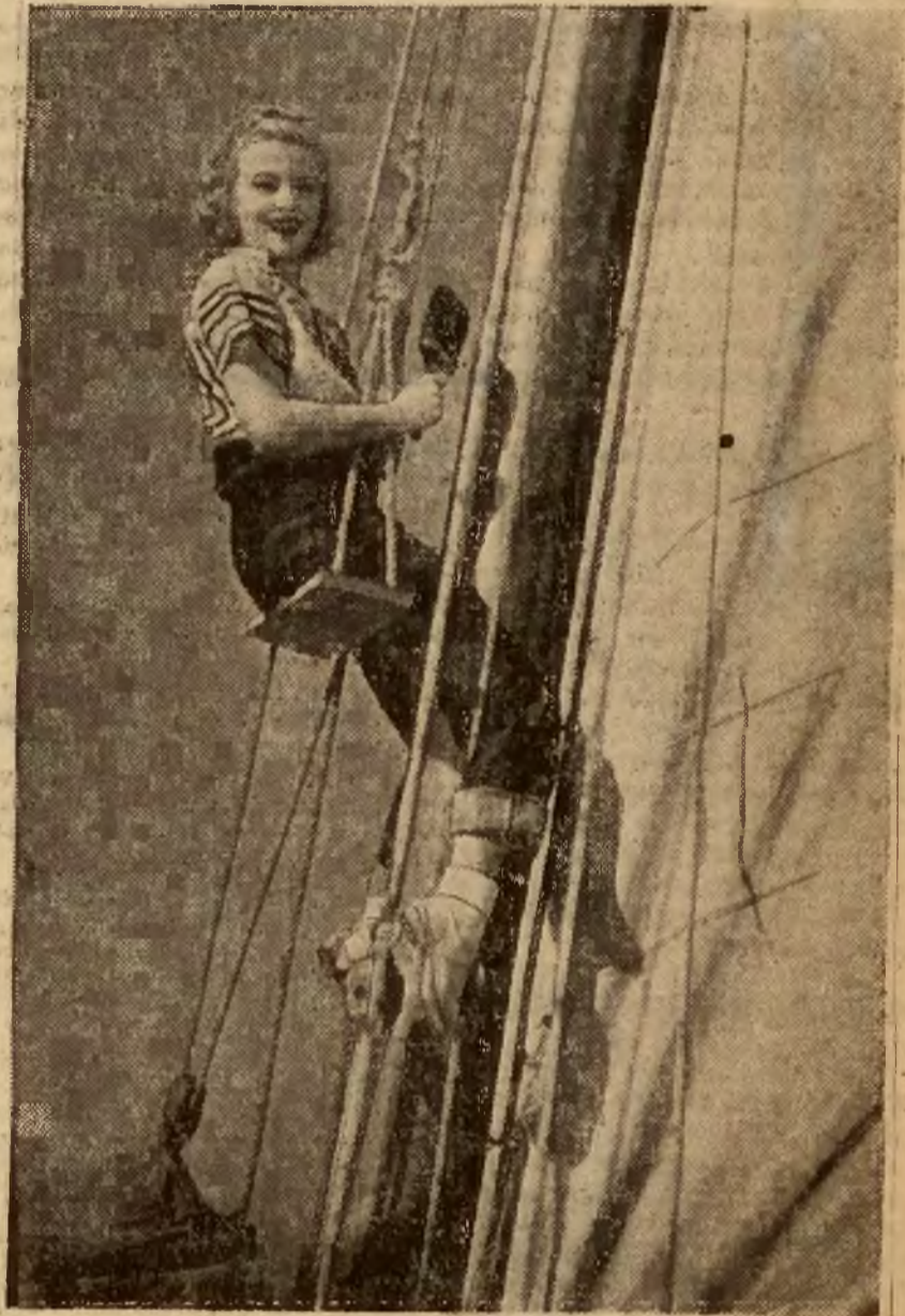
Z pierwszym podmuchem wiatrów wiosennych żeglarze rozpoczęli sezon. Na zdjęciu rodzajowy obrazek z rozpoczętego sezonu żeglarskiego.