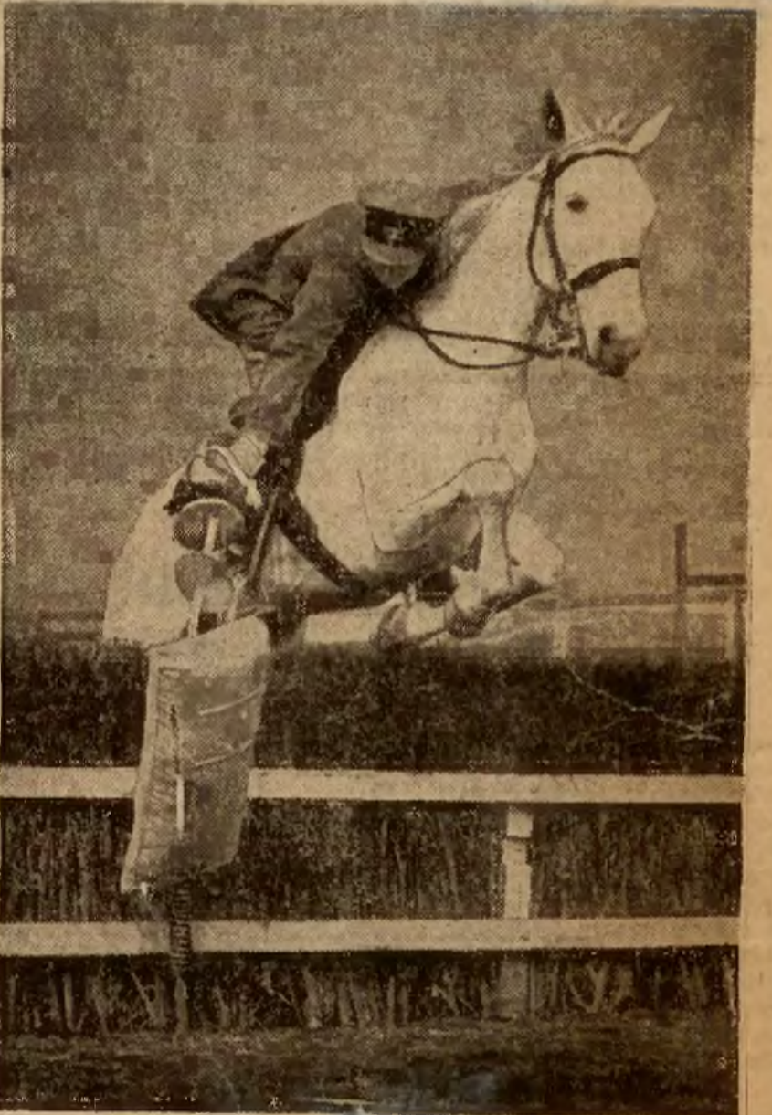
Zdjęcie przedstawia fragment walerii angielskiej w Aldershot.