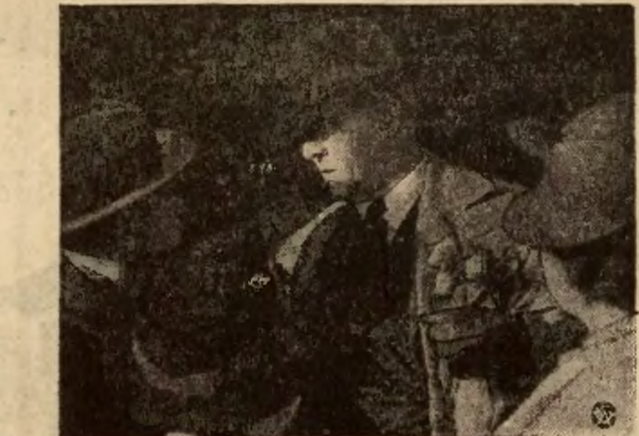
Przybył do Warszawy światowej stawy spiewak Rosjanin, Szalopin, który wystąpi gościnnie w specjalnym koncercie, będącym atrakcją świata kulturalno-muzycznego stolicy. Szalopin na Dworcu Głównym, po przyjeździe do Warszawy.