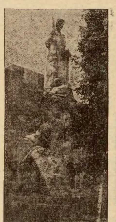
Pomnik Nieznanemu Żołnierzowi w Łotwie.

a przecież Łotwa zajmuje tereny polodowcowe i musiały się tu kiedyś kamienie znajdować i to w dużej obfito