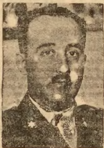
FRANCESCO — NAJMŁODSZY Z GENERALÓW.

Francisco Franco urodził w roku 1891 w hiszpańskiej prowincji Galicja; pochodzi on z starej oficerskiej rodziny i środowisko, w jakim się wychował, wywarło znaczny wpływ na wybór zawodu i późniejszą karierę młodego Francisco. Życie jego płynęło naogół pomyślnie, powodzenie dopływało we wszystkim. Jedyną tragiczną nić, przewijającą się stale przez bieg jego losów, to niestała wola i nienawiść pomiędzy nim, a jego bratem, Ramonem.