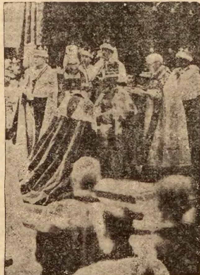
Moment holdu, składanego królowi Jerzemu VI, bezpośrednio po koronacji. Obok na prawo stoi arcybiskup Canterbury, który dokonał koronacji króla. —