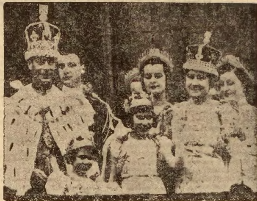
Król Jerzy VI, królowa Elżbieta oraz księżniczki: Elżbieta i Małgorzata Róża z koronami na głowach, bezpośrednio po akcie uroczystej koronacji angielskiej pary królewskiej.