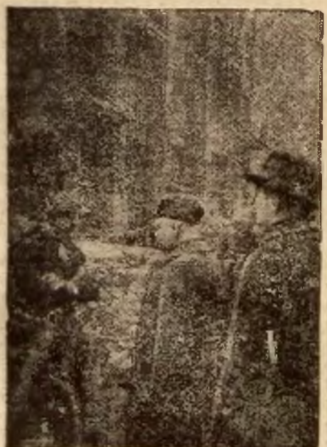
Pan Premier z rozmowami z robotnikami, zatrudnionymi przy robotach drogowych w Sosnowcu.

anarchistów, którzy uzbrojeni w karabiny maszynowe i bomby, nie pozwalali sile zbrojnej na podjęcie ataku. Wobec tego sklerowano silny ogień armatni na cały budynek, który rozleciał się formalnie w gruzy, przyczem ściany obsunęły się do morza, pociągając za sobą wszystkich znajdujących się wewnątrz. Akcja ratownicza dała minimalne wyniki