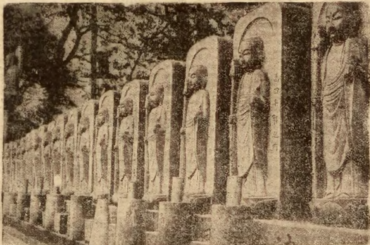
Są to niektóre z pomiędzy 10.000 kamiennych posągów Buddy, które są ustawione przed świątynią Syomyoin w Japonii. Przewidują się dalsze wznoszenie tego rodzaju figur kamiennych dopóty, aż w przyszłości w oznaczonym miejscu znajdzie się ich 84.000.