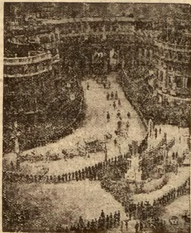
Rzucił oka z góry na wspaniałą pochód koronacyjny zdążający z pałacu Buckingham do Westminsteru.