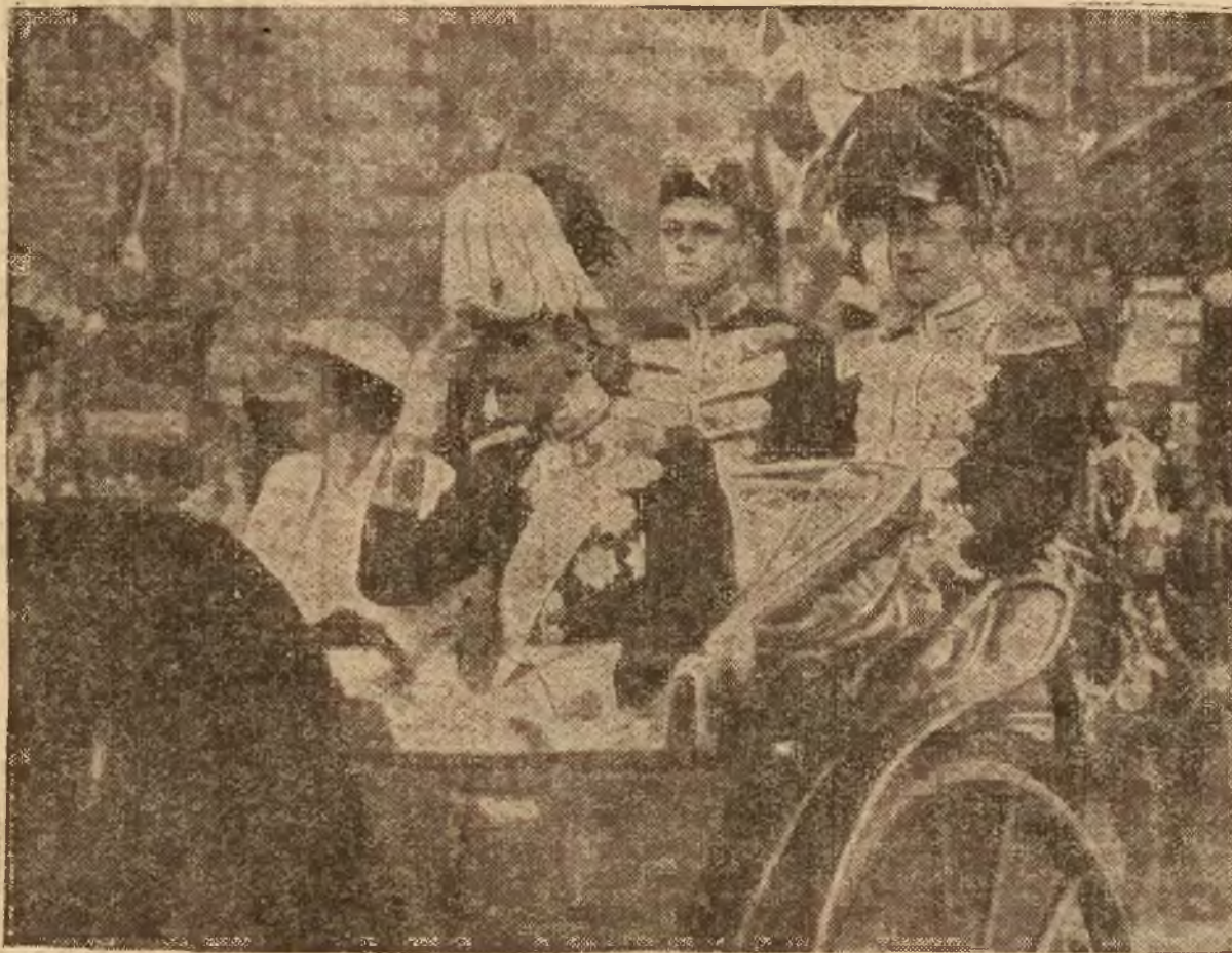
Król duński Christian V z królową Aleksandrą przyjeżdża przez ulice Kopenhagi na obchód 25-lecia panowania.