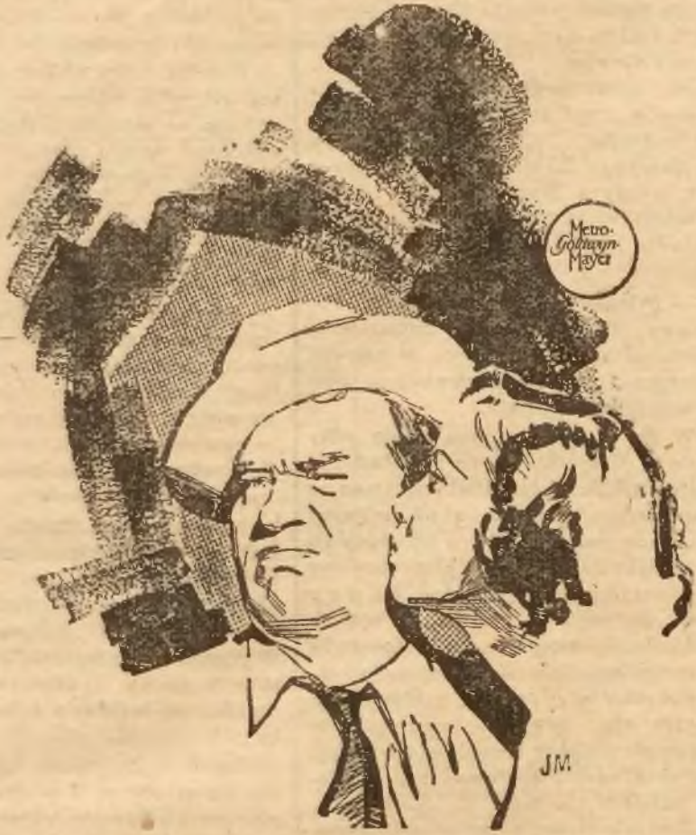
Wallace Beery i Cecilia Parker w filmie „Darmozjad”.

Jego szeroki uśmiech, poczciwe oczy, specjalnego kształtu nos znają widzowie kin całego świata. Wszyscy go lubią i cenią. Jego kreacje aktorskie są zawsze na najwyższym poziomie. Męska brzydota Wallace'a Beery nie jest „sex appealizacja”, ale jest za to sympatyczna i ujmująca.