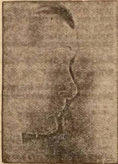
Robert Montgomery w karykaturze.

Wesoly, lekkomyślny, przystojny i miły — oto epitety określające Roberta Montgomery. Czy jest również utalentowany? Na to pytanie odpowiada jego sława, dzięki której stał się królem de-