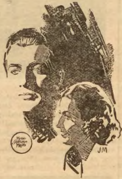
Robert Taylor i Barbara Stanwyck w filmie „Poświęcenie”.

Barbara Stanwyck i Robert Taylor kreują główne role w filmie „Poświęcenie”. Obok nich wystąpią Jean Hersholt i Joseph Callia. Reżyserował: W. S. Van Dyke.