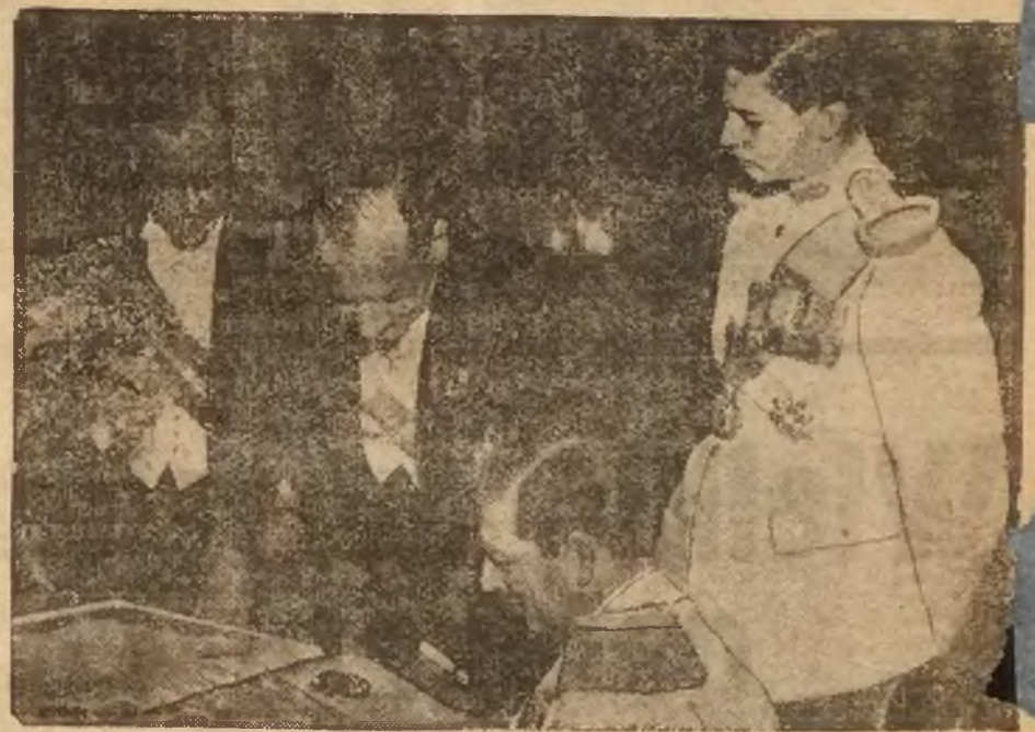
J. K. M. król Karol z zainteresowaniem ogląda przedstawione JKM przez min. Becka tablice genealogiczne, wywodzące pokrewieństwo J. K. Mości z dawnymi polskimi rodami królewskimi.