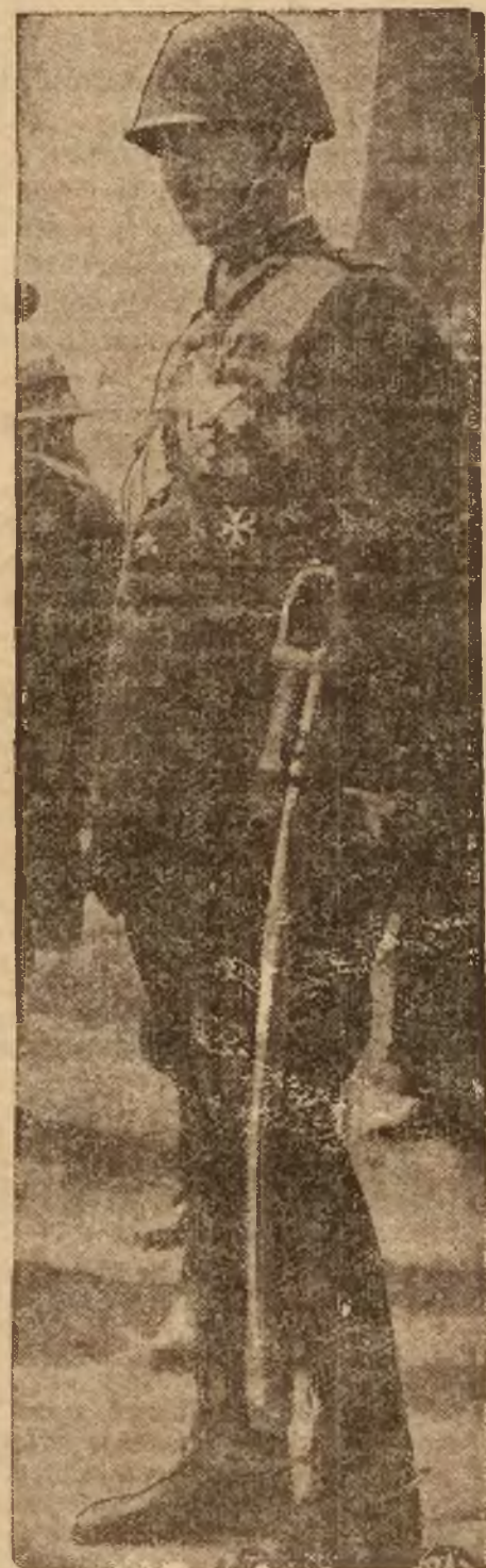
Jego Królewska Mość król Karol II w mundurze pułkownika piechoty wojsk pol.

MOSKWA, (PAT.) — Na sesji wyjazdowej wojskowego kolegium sądu najwyższego ZSRR w Chabarowsku odbył się proces 37 funkcjonariuszów kolei daleko-wschodniej oskarżonych o „trocckizm”, szpiegostwo na rzecz Japonii i działalność sabotażową. Wszyscy oskarżeni zostali skazani na karę śmierci przez rozstrzelanie. Wyrok wykonano. W ciągu ostatniego miesiąca rozstrzelano na Dalekim Wschodzie pod anielicznymi żurawiami 131 osób.