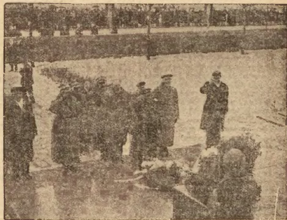
Moment złożenia hołdu Sercu Marszałka Józefa Piłsudskiego przez delegację Ogólnopolskiego Zjazdu POW u stóp mauzoleum na cmentarzu Rossa. W pierwszym szeregu widzimy: min. Kościłkowskiego, płk. Koca, gen. Dąb-Biernackiego i gen. Kruszewskiego.