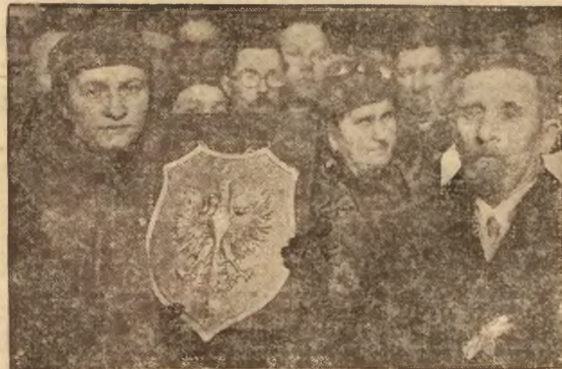
Artystyczny ryngraf, dar Śląskiego Okręgu POW, który został zawieszony w Ostrej Bramie, po poświęceniu go przez J.E. ks. metropol. Jelbrzykowskiego.